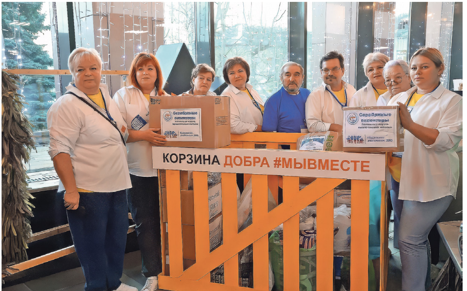
«Серебряные» волонтеры.

В ходе реализации регионального проекта во всех муниципальных образованиях области планируется создание центров «серебряного»