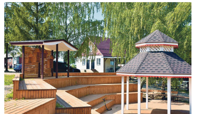
Проект «Толокно».