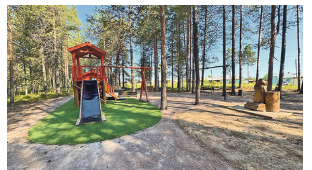
Мишкин лес.