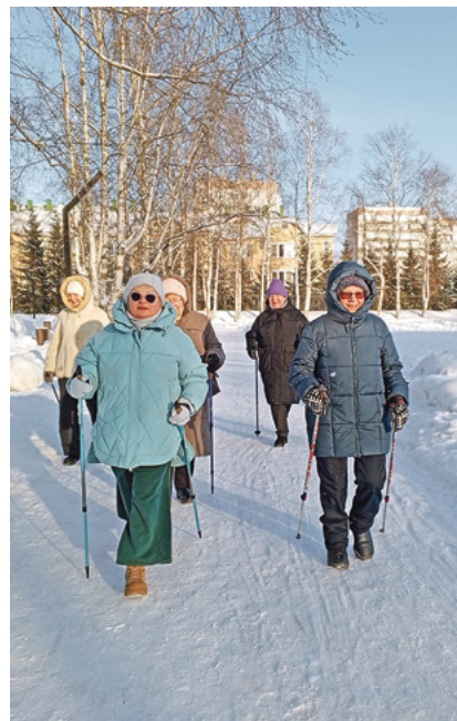
Спорт – в любом возрасте.