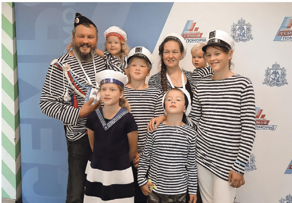
Форум «Семья Поморья»

В планах регионального проекта «Семья Поморья» на 2025–2026 годы: расширение сети семейных МФЦ, стопроцентное введение в школах курса «Семьеведение», разработка программы наставничества.