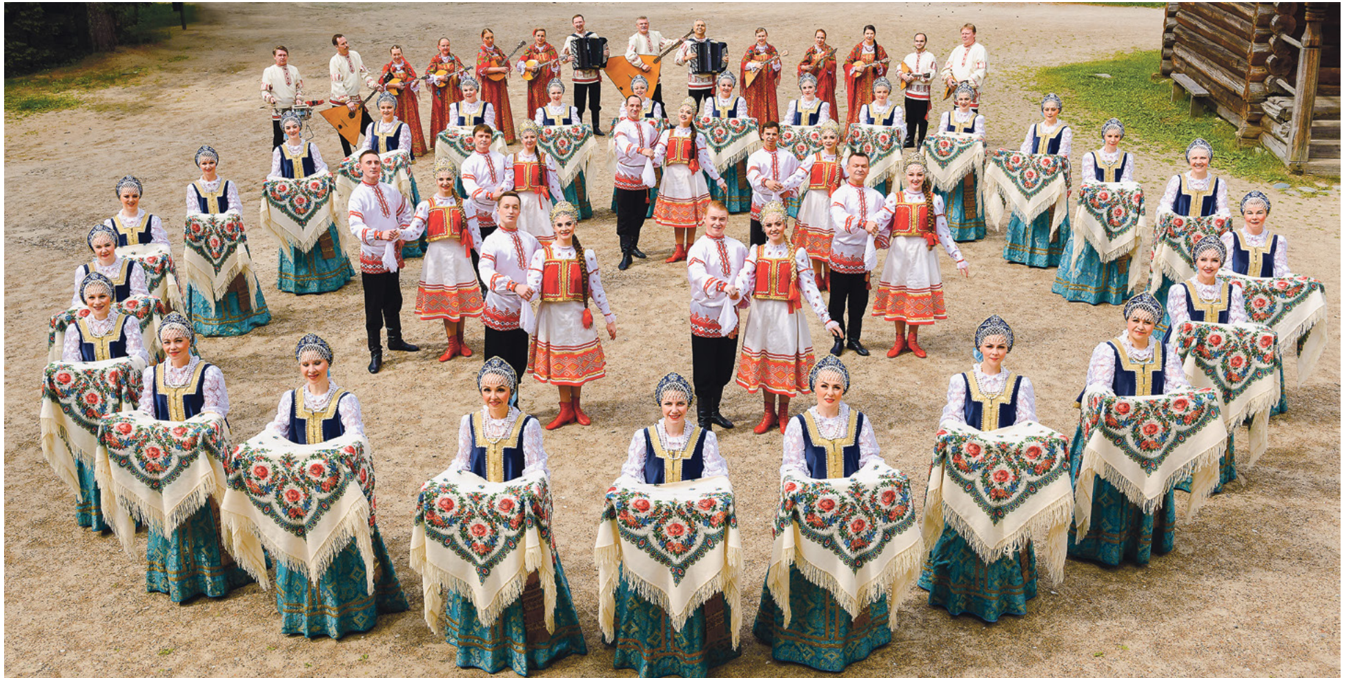
Северный русский народных хор.

В сфере культуры Архангельской области реализуется главный принцип – сохраняя наследие, создавать самые современные условия для развития и реализации творческого потенциала каждого, кто наделён талантом.