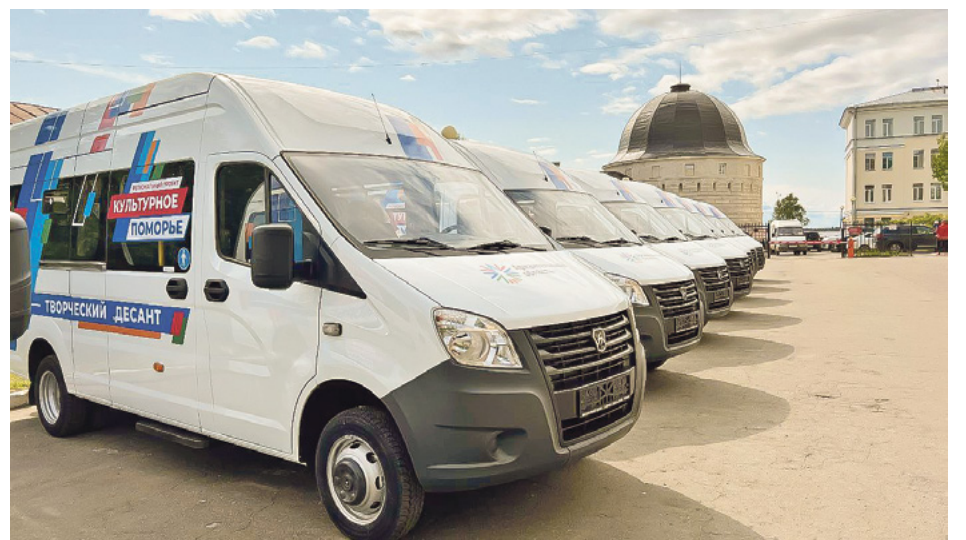
Автобусы «Культурного десанта».

Развитие культуры – это инвестиция не только в облик региона, но и в его душу, в то, что объединяет нас в одно большое «мы»