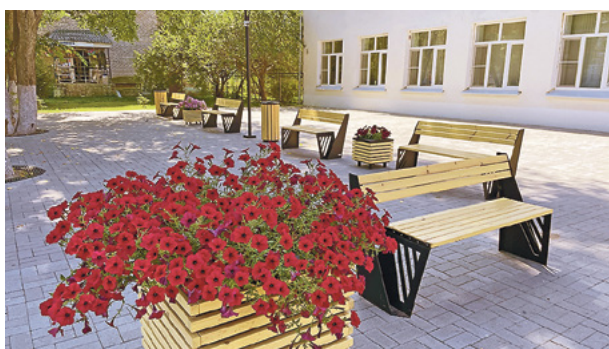
«Няндомы зацветёт».