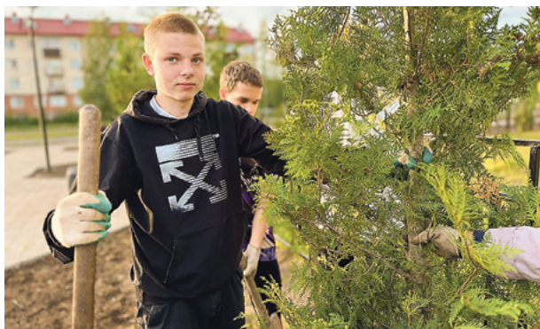
«Няндомы зацветёт».

«Комфортное Поморье» – это не просто проекты, это истории людей, которые своим трудом и вовлеченностью помогают преобразовать территорию и решать вопросы культурной, социальной, спортивной, инженерной инфраструктуры