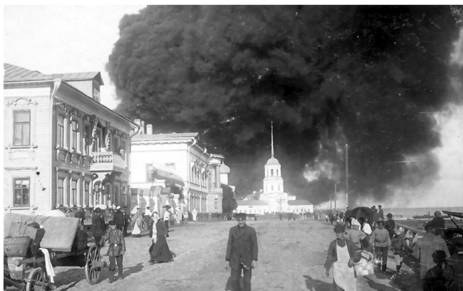
Пожар на Смольном буяне