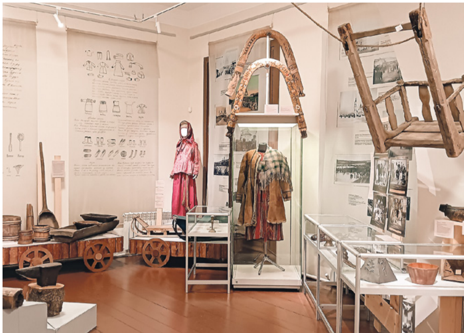
Одежда для праздника и повседневности

Рябово Вельского уезда, а сделал он её в 1814 году.