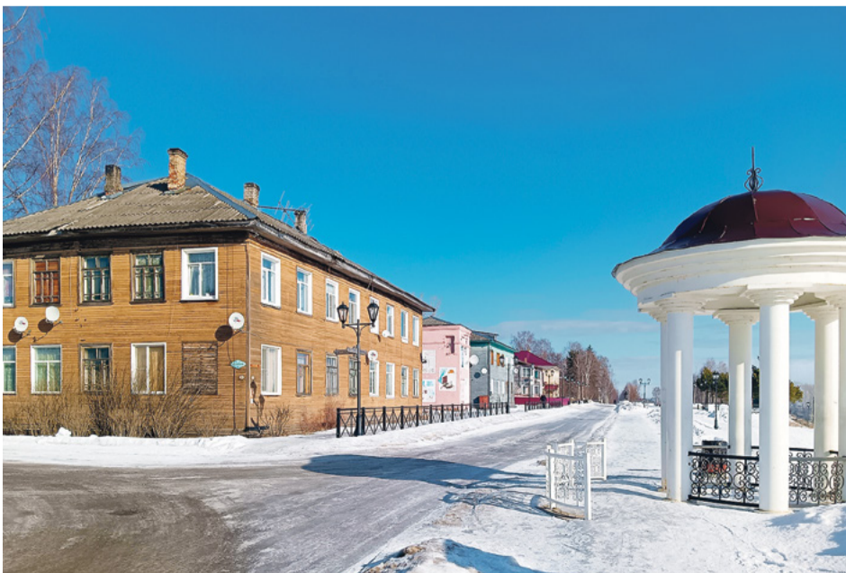
Беседка – современное дополнение к историческому облику города

Беседовала Светлана ЛОЙЧЕНКО