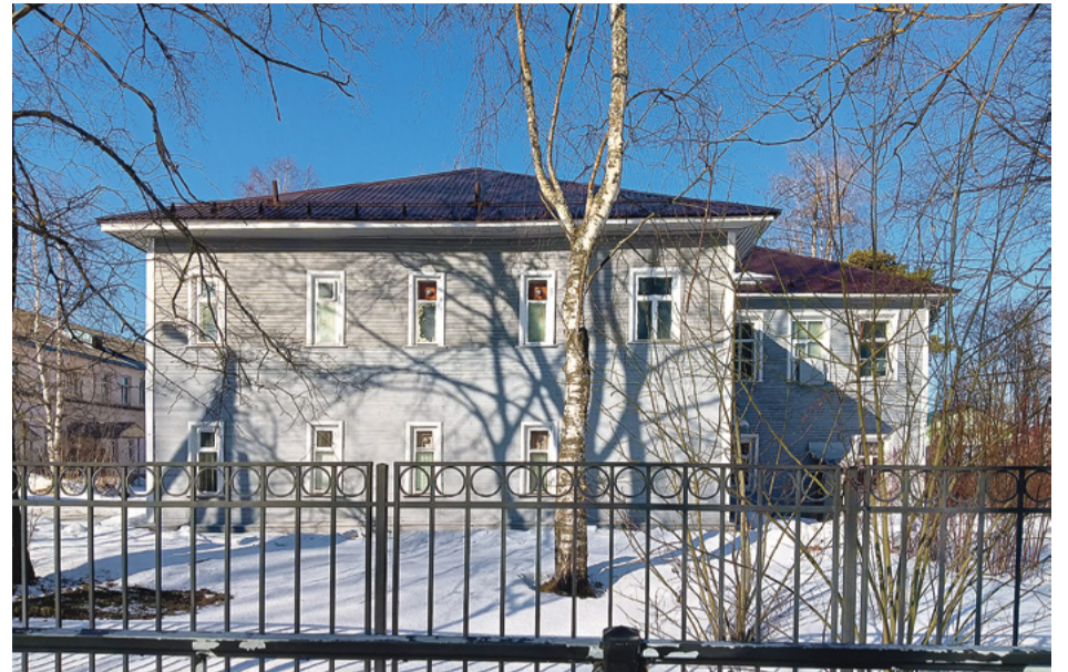
В Вельске сохранились многие здания, построенные в разные времена