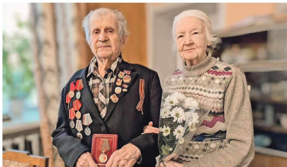
«Если в сердце есть место для любви...»