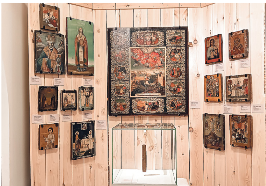
Иконы, которые бережно хранились в семьях потомков крестьян Поважья