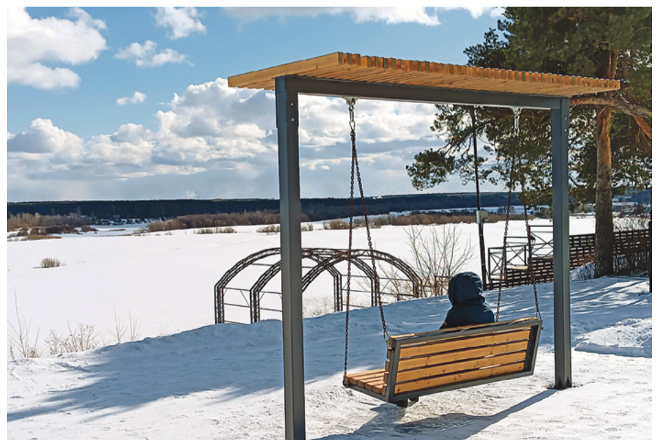
Качели с видом на пойму реки Ваги