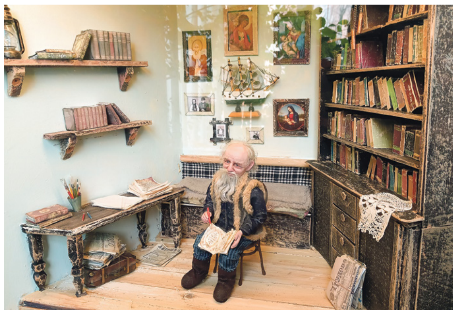
Степан Писахов попал в «Дом архангельской сказки»