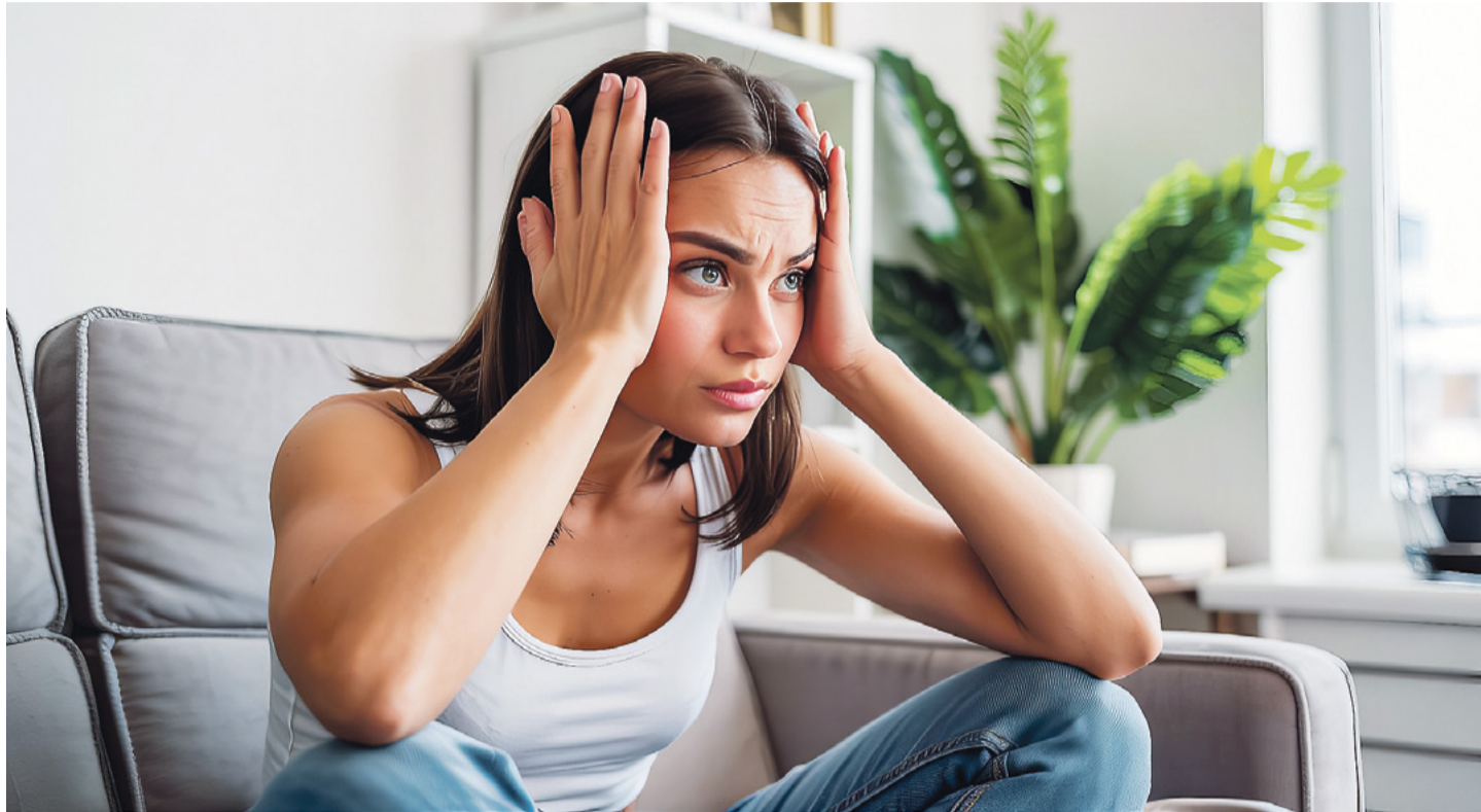
Начать «новую» жизнь никогда не поздно

Несколько лет назад у меня в практике была история. Молодая пара