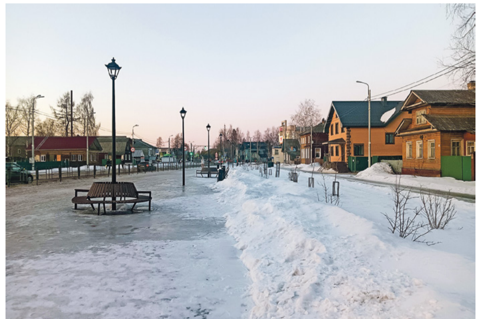
Широкие улицы и проспекты сохранились в городе со времён Екатерины Второй, когда создавался генплан города