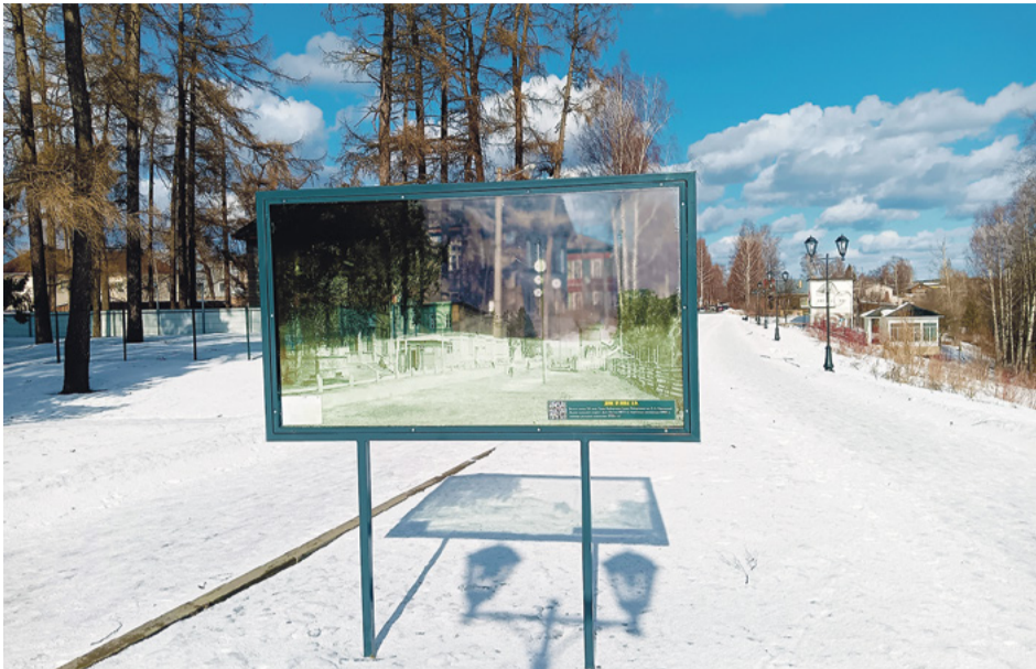
Через такое «окно в прошлое» можно увидеть, как город выглядел сто лет назад