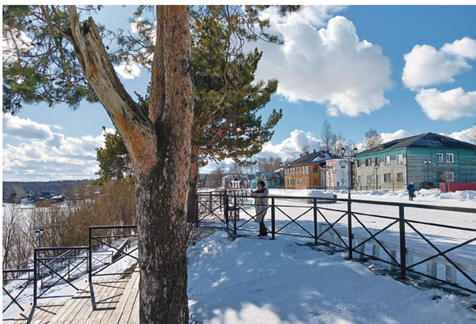
Обновлённая набережная стала украшением города и вписалась в его исторический облик

И сейчас мы разрабатываем программу для магистров по Архангельску и по Архангельской области, но, конечно, всю область нам не осилить. Архангельская область обладает огромным потенциалом. Надо выбрать опорные города, на которых мы сосредоточим свои усилия. Изучив стратегию развития туризма региона, которую подготовило министерство культуры Архангельской области, определили, что в этой стратегии обозначены города, которые являются опорными центрами. Одним из этих центров оказался Вельск, поэтому мы решили познакомиться с этим малым городом и проехать в Архангельск через Вельск.