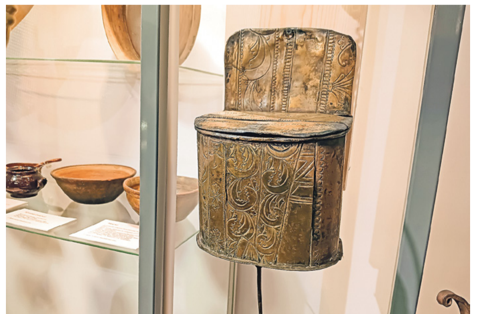
Этот рукомойник сделан из оклада иконы