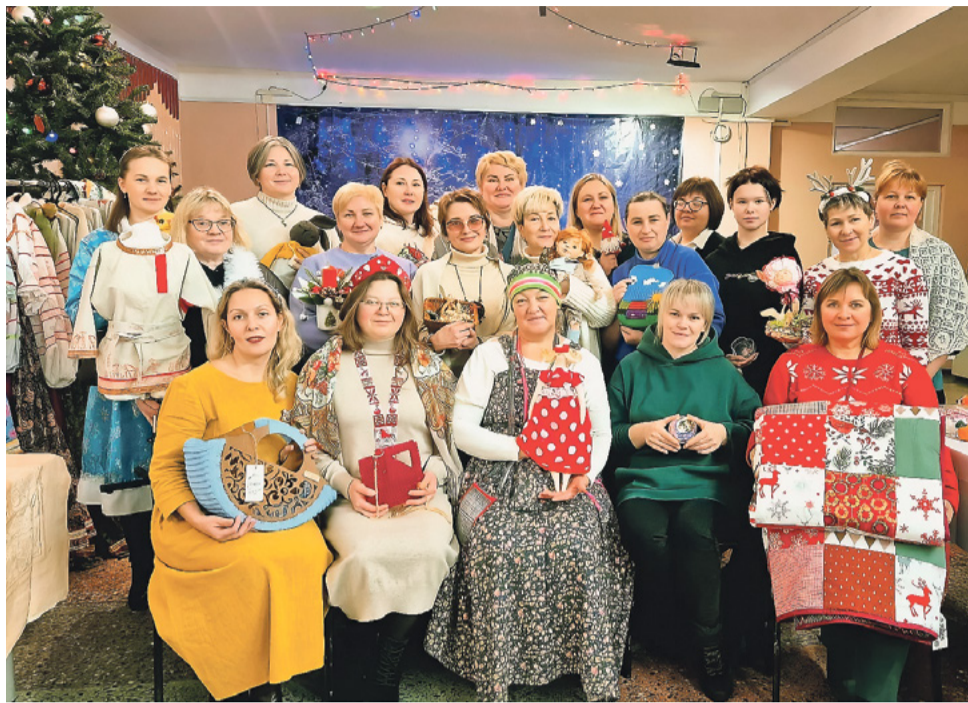
Участники конференции «Живём всема, чтобы деревня развивалась и зарабатывала»

Причём организаторы проектов пришли к выводу: дело спорится и развивается прежде всего там, где за него берутся «всема» – семьями. Так, в деревне Кушово всё началось с идеи