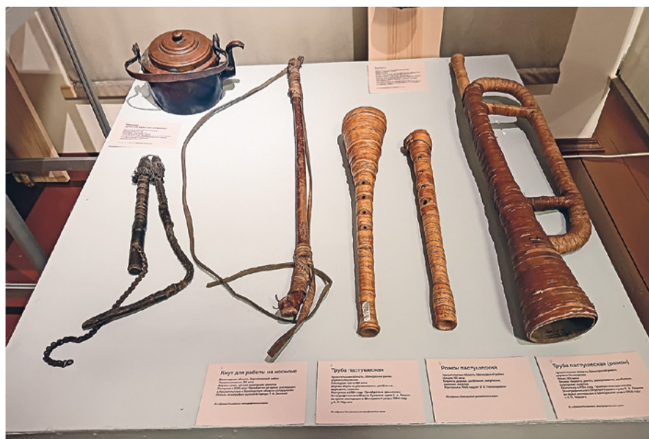
Кнут, рожок и трубы пастушеские

Удивительно, насколько крестьянство придавало значение слову, верило в его силу в прямом смысле. Заговоры эти тоже представлены на выставке. Они больше похожи на молитвы, все начинаются с обращения к Богу, Матери Божьей, святым. Конечно, такие обереги прежде всего посвящались значительным семейным событиям. К примеру, на выставке представлен рукописный оберег перед отправкой свадебного поезда от дома жениха. Тут же можно увидеть рукопись этого заговора. Она принадлежала жителю деревни