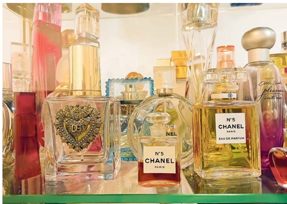
Духи «Шанель № 5», хранящие запахи Русского Севера