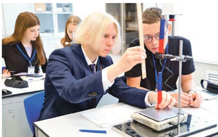
В центре «Созвездие» созданы все условия для дополнительного образования детей