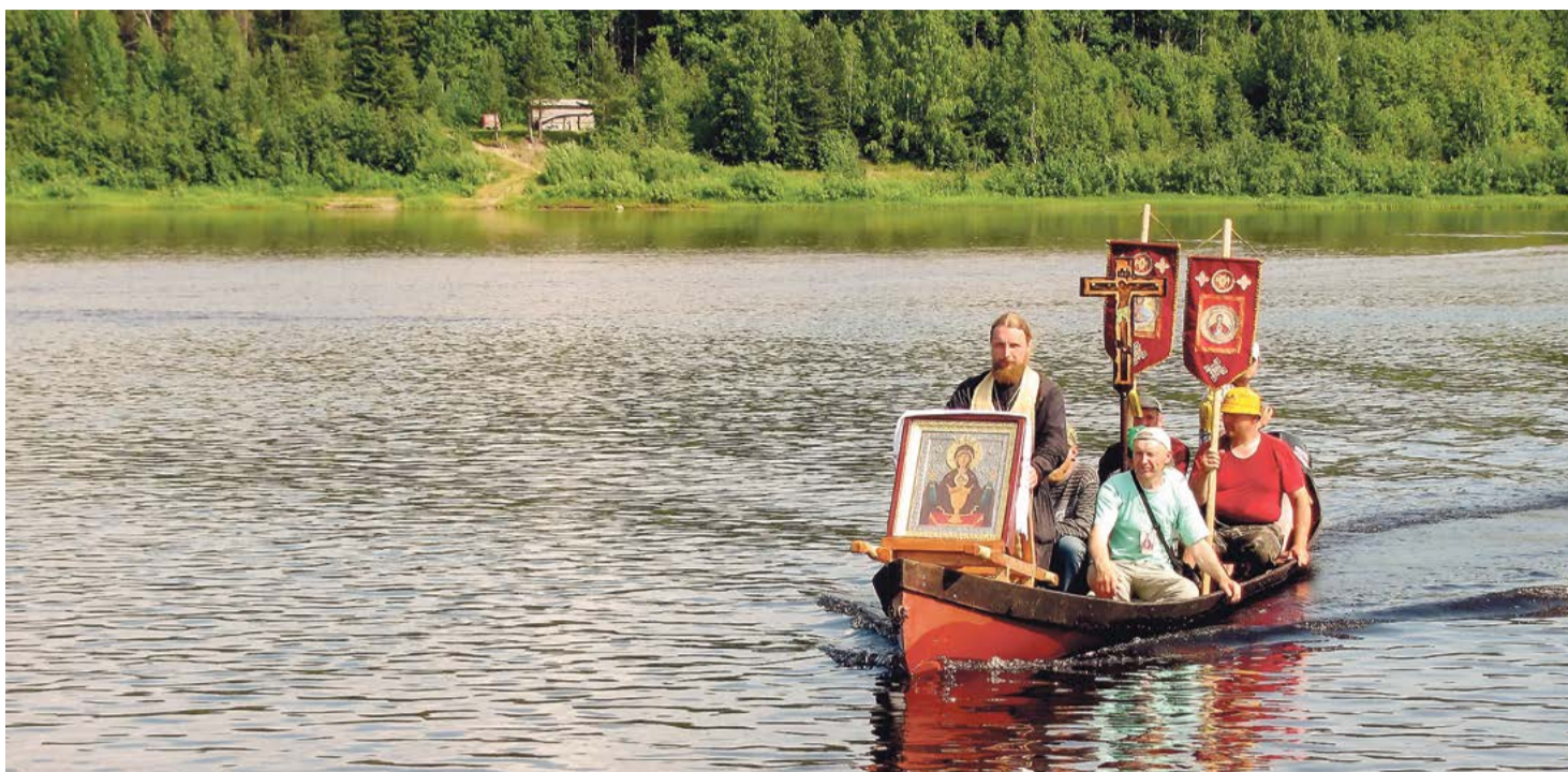
Переправа через Пинегу