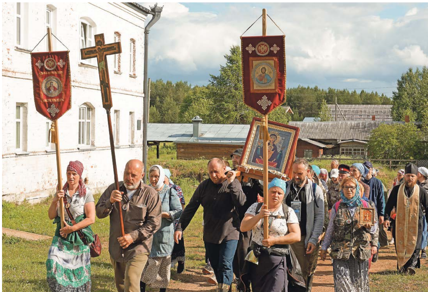
Возвращение крестоходцев в Артемиево-Веркольский монастырь

Меня всегда поражают и восхищают люди, которые, несмотря на свой возраст и болячки, преодолевают этот путь.