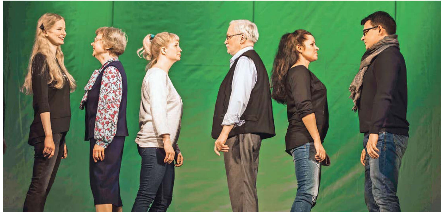
Они и мы: взрослые и подростки

Жанр спектакля определён как «родительское собрание», и речь в нём идёт о проблемах взросления подростка: одиночестве в семье, непонимании и обидном недоверии со стороны взрослых, о причинах детских суицидов, о разных вариантах подросткового протеста. Тема очень важная и вечная, поскольку родительские ошибки иногда роковым образом сказываются на судьбе подростка. Вот об этом говорится в спектакле, в том числе на документальном материале.