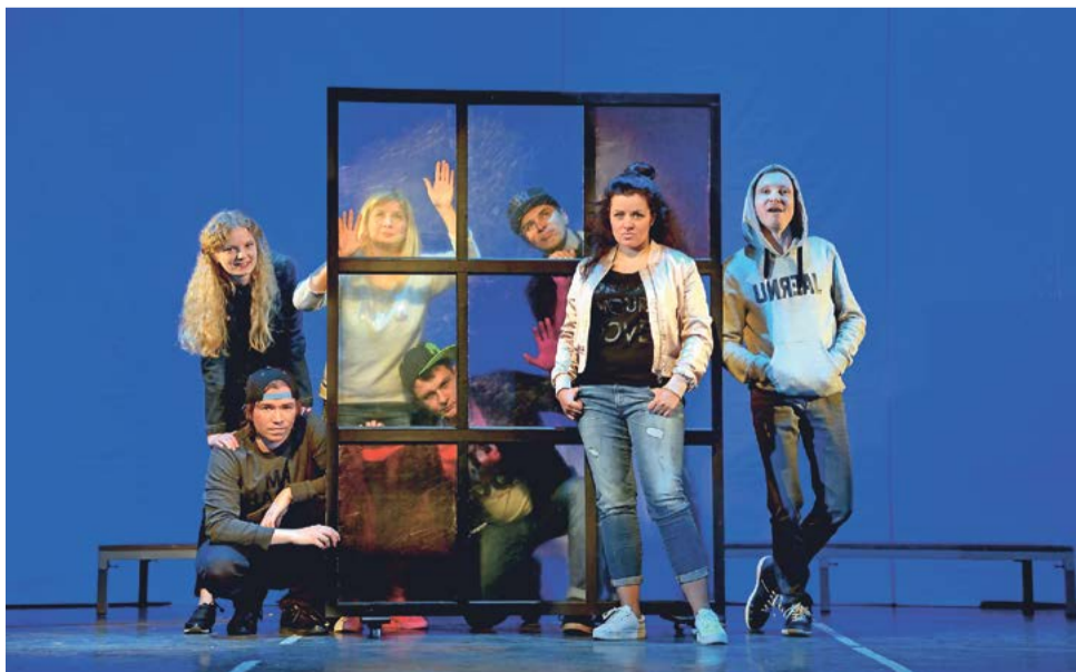
Сцена из спектакля Архангельского театра кукол «Они и Мы»

Елена ИРХА. Фото предоставлено Архангельским театром кукол, Анастасии Сухановской и автора