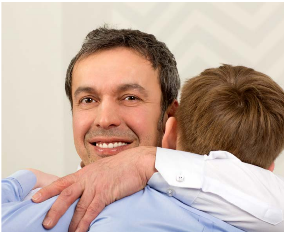
Хорошо, когда семейные конфликты заканчиваются примирением

Наталья ПАРАХНЕВИЧ Иллюстрации Яна Мальцева