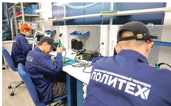
В Архангельском политехе учатся эксплуатации беспилотных авиационных систем

Подготовила Марина СОСНОВА