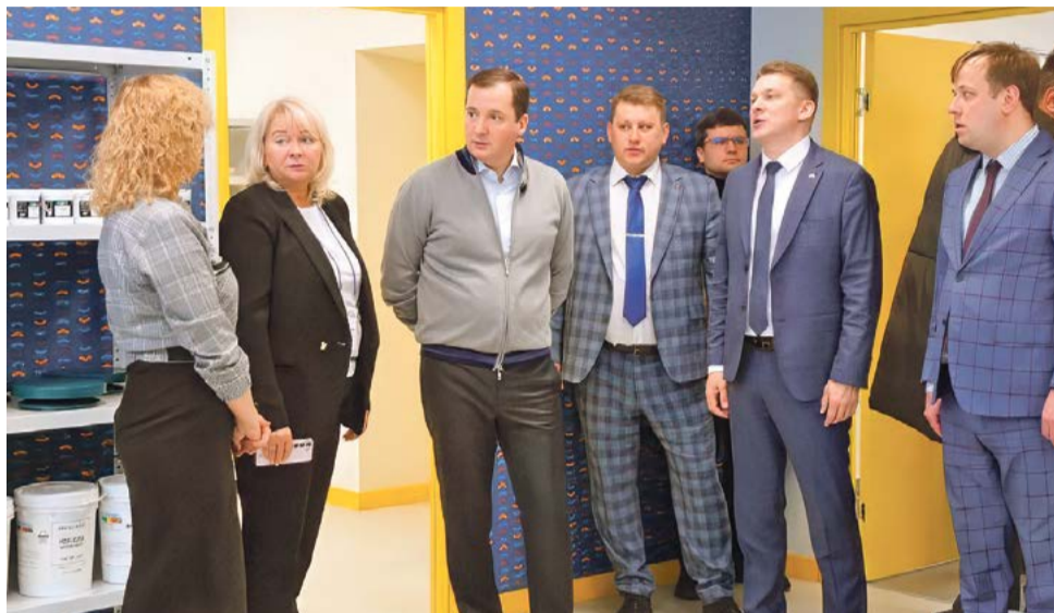
Центр «Созвездие» призван поддерживать одарённых детей

– Деятельность центра заключается в проведении очных образовательных интенсивных смен, организации работы