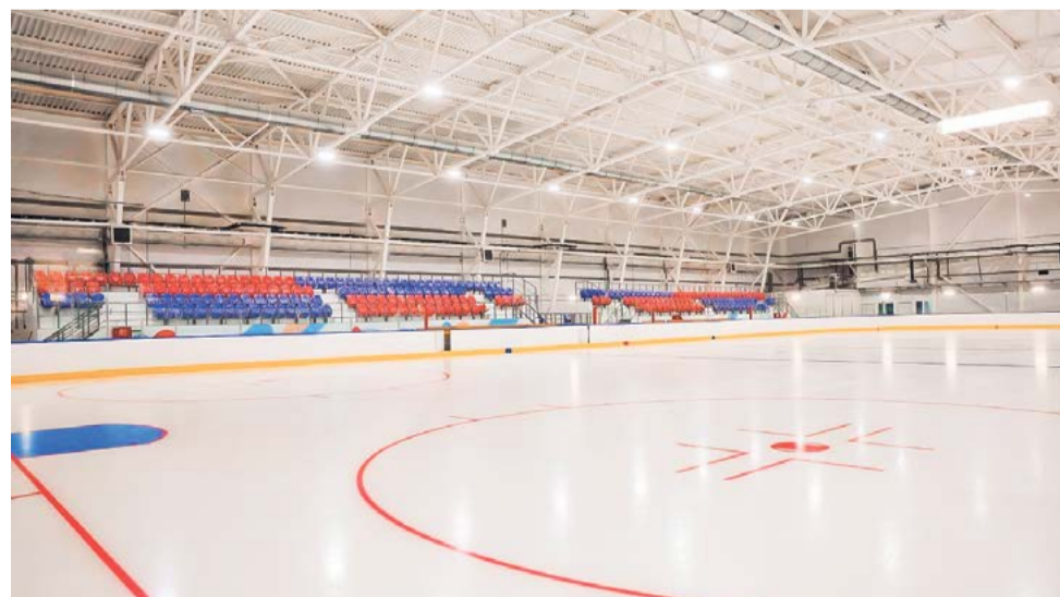
Ледовая арена готовится принять первых посетителей