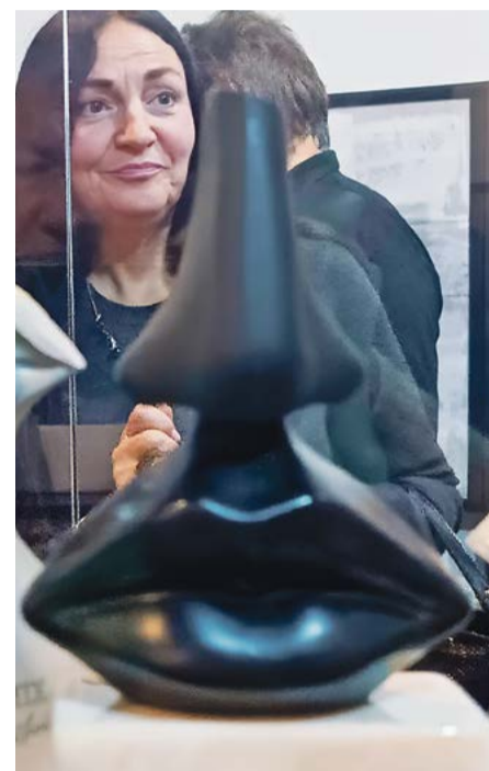
Флаконы из-под знаменитых духов «Сальвадор Дали»

Именно Эрнест Бо, наследник известной парфюмерной фамилии, который в годы интервенции служил в Архангельске в контрразведке, спустя время создал первый в истории нецветочный аромат. Он стал всемирно известным под названием «Шанель № 5». Вот как о его создании рассказывал сам Эрнест Бо: «Я создал эти духи в 1920 году, когда вернулся с войны. Часть моей военной кампании прошла на Севере