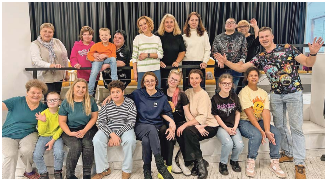
Слагаемые успеха: творчество, кропотливый труд и огромная любовь к детям

Северодвинский театр «Волшебство в ладошках» – один из лучших в России