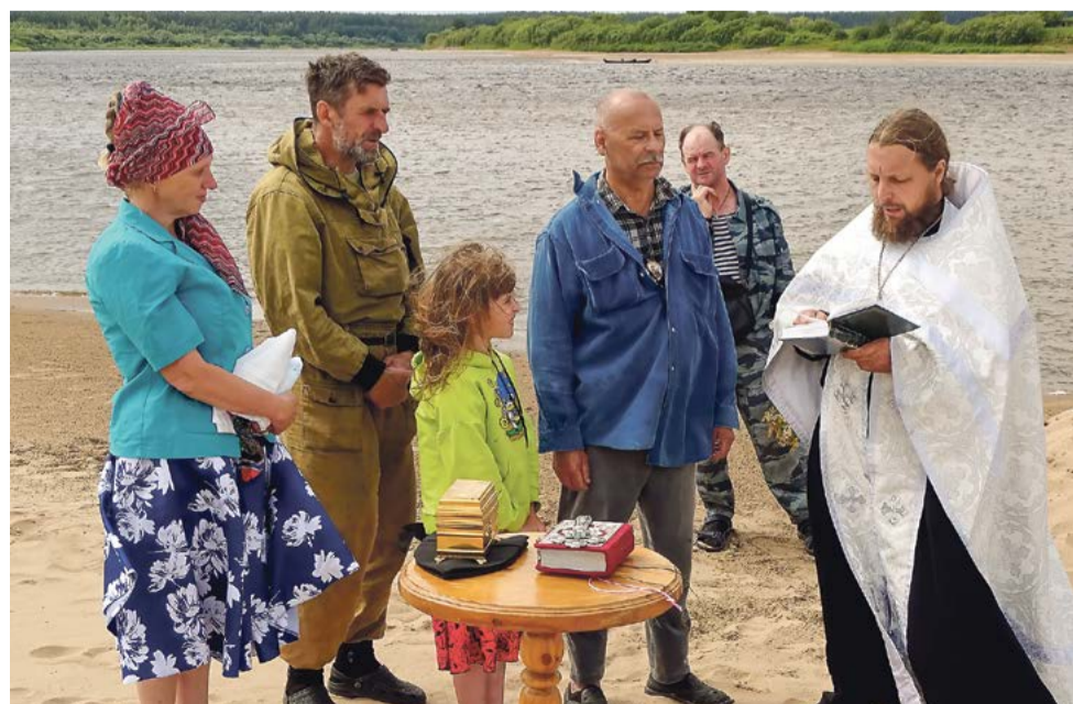
Крещение в реке Пинеге

Людмила СОСНИНА