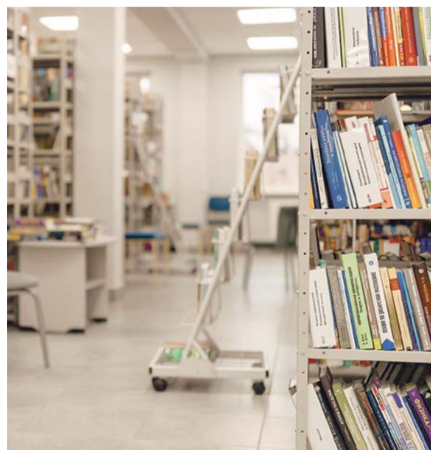
Чтобы попасть на полки библиотеки, книга проходит непростой путь

У библиотекарей муниципальных библиотек много вопросов возникает по использованию федеральной субсидии на комплектование, которую выделяет Министерство культуры России. Эта субсидия нацелена на формирование ядра фонда, то есть покупку таких книг, которые удовлетворят не сиюминутный читательский спрос, а послужат своего рода основой, фундаментом библиотечного фонда. Качественные справочные издания и научно-популярная литература, классическая литература, хорошо изданные детские книги – такие книги будут востребованы на протяжении многих лет. Но обязательно должны быть и книжные новинки,