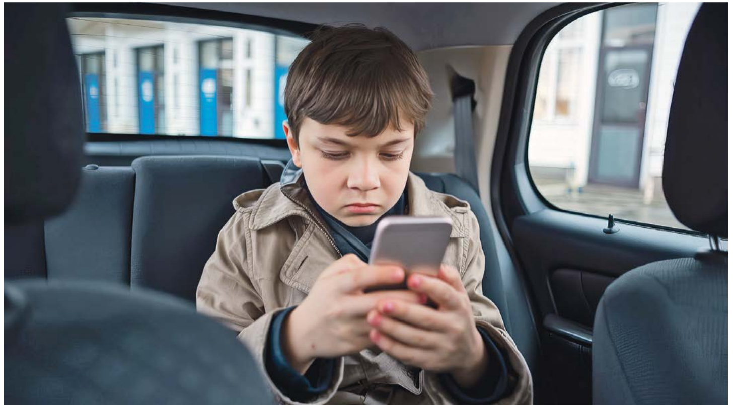
«А почему ты не делаешь, когда я тебя прошу?»