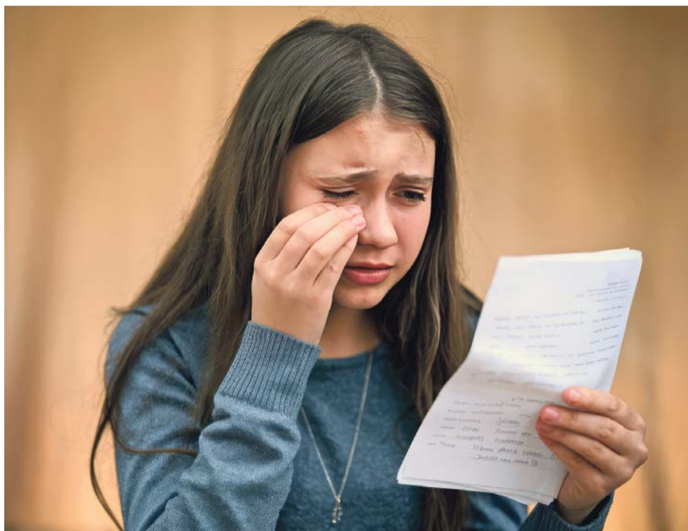
«Но самое тяжёлое – развод родителей, когда ребёнок слышит: «У тебя больше нет отца!»

Небольшой посёлок. Девочка-семиклассница – умница, красавица, хорошо учится. На торжественной линейке в качестве поощрения её как активистку награждают путёвкой в знаменитый лагерь. Ребёнок светился от счастья! И в этот момент, возможно, от обиды, одна из одноклассниц при всех заявила: