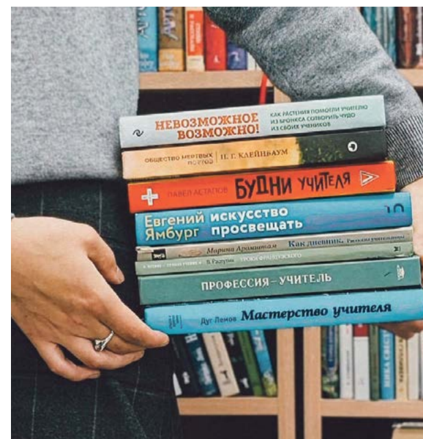
Книги из нового поступления в библиотеку имени Добролюбова

Как купить и подарить библиотеке книгу, можно узнать, перейдя по QR-коду