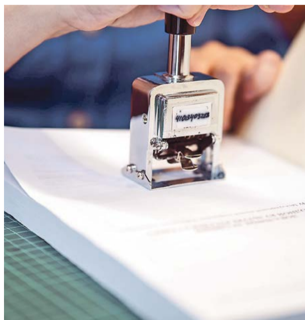
Так проходит маркировка новой книги с помощью специального нумератора