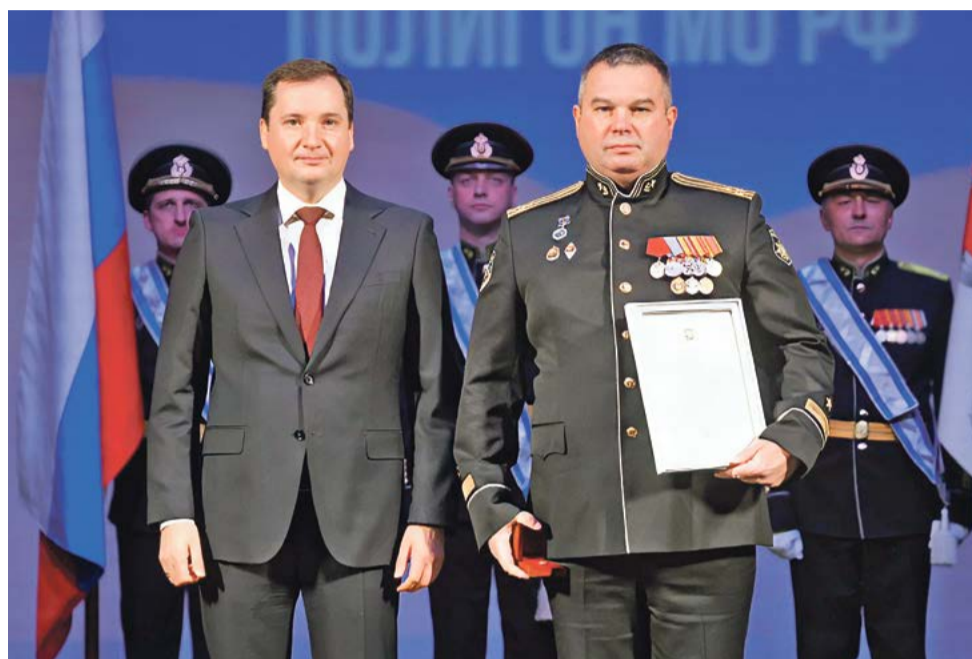
Награды – лучшим сотрудникам Центрального морского полигона Министерства обороны России

– Крытая ледовая арена теперь позволит проводить городские и областные соревнования, придав новый импульс развитию хоккея с шайбой в Северодвинске и в целом