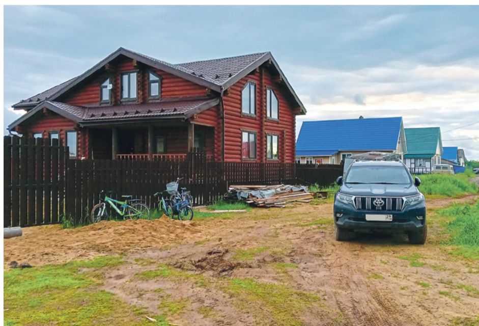
На «мезенской Рублёвке»