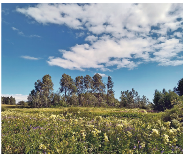
Просторы в Кянде по-настоящему сказочные...

Тётка Камбалиха проводит экскурсии по музейным выставкам, рассказывает о житье поморов, загадывает загадки, а также делится мастерством – организует