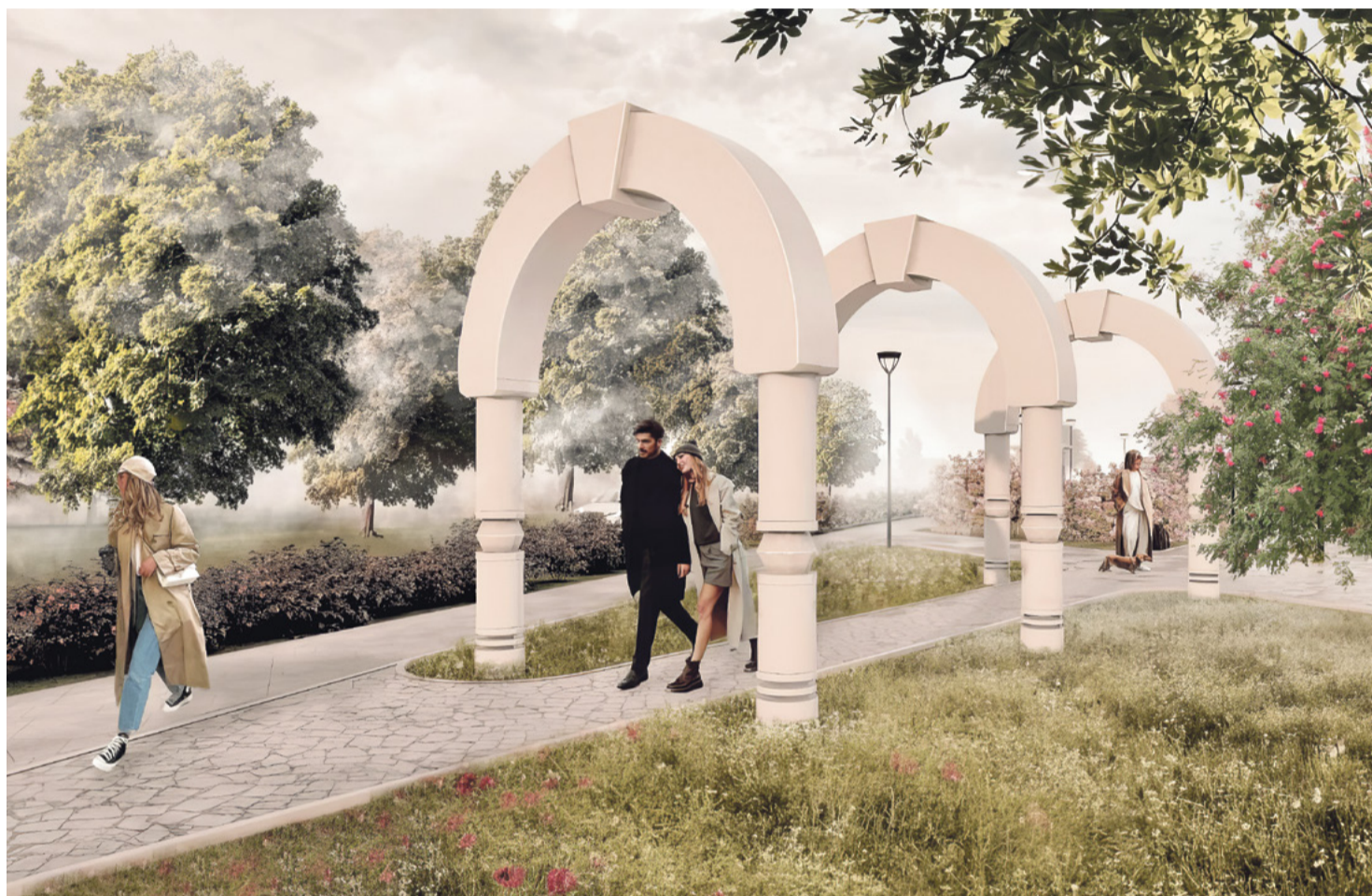
Так будет выглядеть прогулочная зона на набережной Сольвычегодска

Отметим, что инициативы Архангельской области регулярно входят в число лучших. Как сообщает пресс-центр регионального правительства, из тринадцати проектов-победителей восемь уже реализованы, по пяти работы продолжают. Так, например, Мирный этим летом получил замечательный подарок к своему дню рождения – завершено обустройство пространства возле озера Плесцы. Проект носит название «Звёздный берег». Основные преобразования затронули парк им. Г. Е. Алпаидзе. В пресс-службе главы Мирного пояснили, что реализация проекта предусматривала не только благоустройство территории – установку малых архитектурных форм, оборудование детской