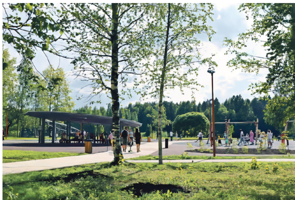
Основные преобразования в Мирном затронули парк им. Г. Е. Алпаидзе