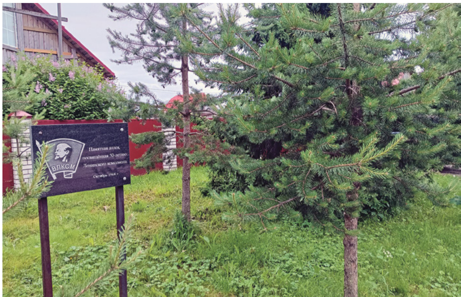
Комсомольская аллея, посаженная в октябре 1968 года