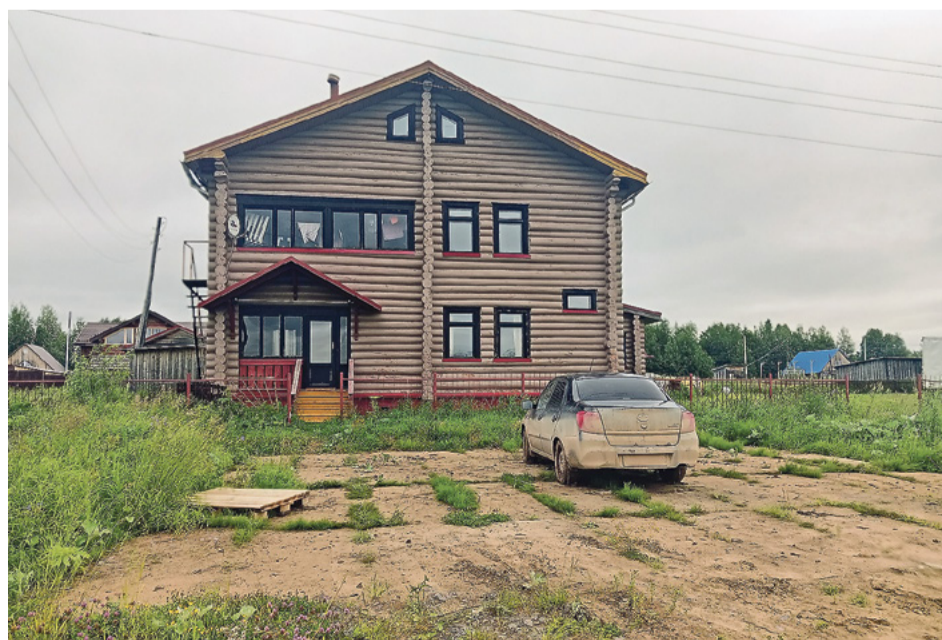
Гостевой дом, который предназначался для геологов

Из Архангельска до Мезени почти четыреста километров, ехали часов семь, и всё же, учитывая все эти заминки и неудобства, дорога почему-то трудной не показалась.