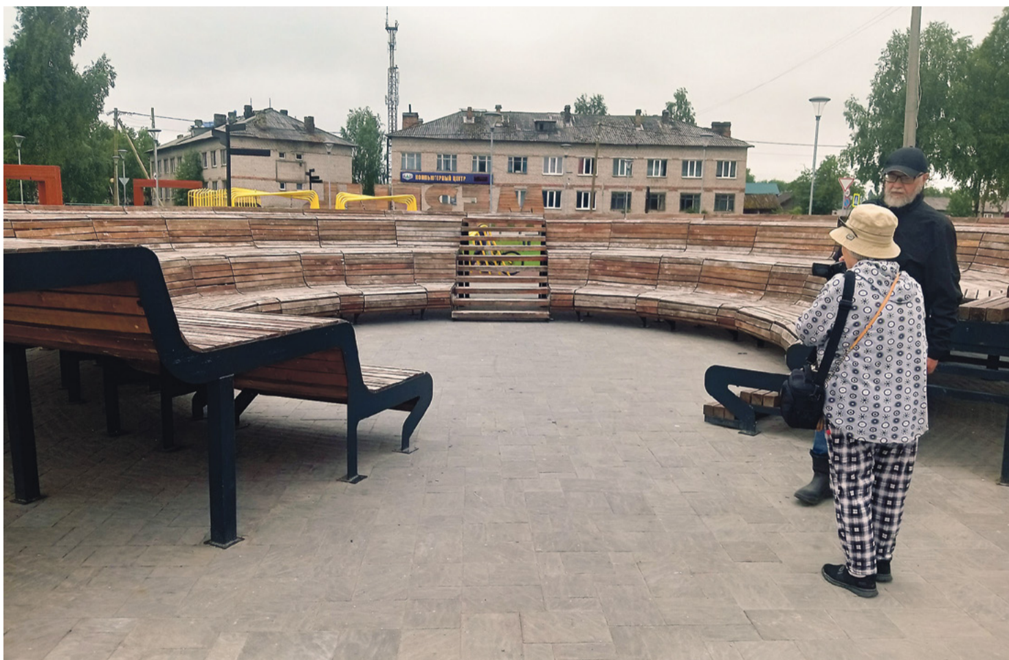
Амфитеатр на Ярмарочной площади предназначен для общения

Как добраться до Мезени? Стоит позвонить по телефону, который легко найти