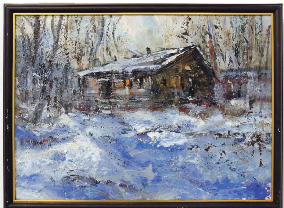
Альберт Ошомков «Изба в лесу»