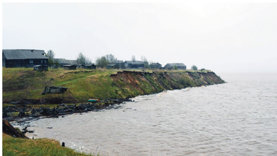
Деревня Сёмжа стоит на высоком берегу реки Сёмжи

А ещё рассматривали первые посетители клейма, сделанные топором или ножом, грубые и узорные, – на сапожной колодке, на грабилке для ягод,