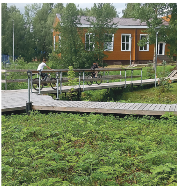
Переходы в парке можно использовать в качестве велодорожек