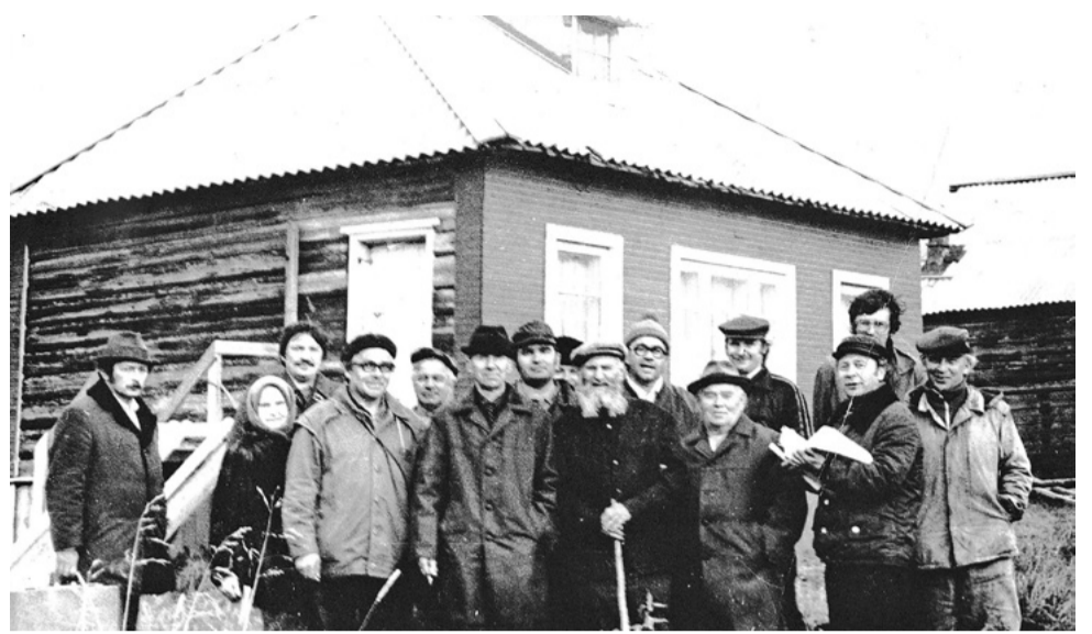
Во время открытия Дома памяти в Сёмже. 25 августа 1984 года