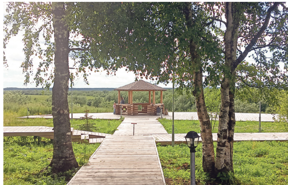
Беседка в Молодёжном парке