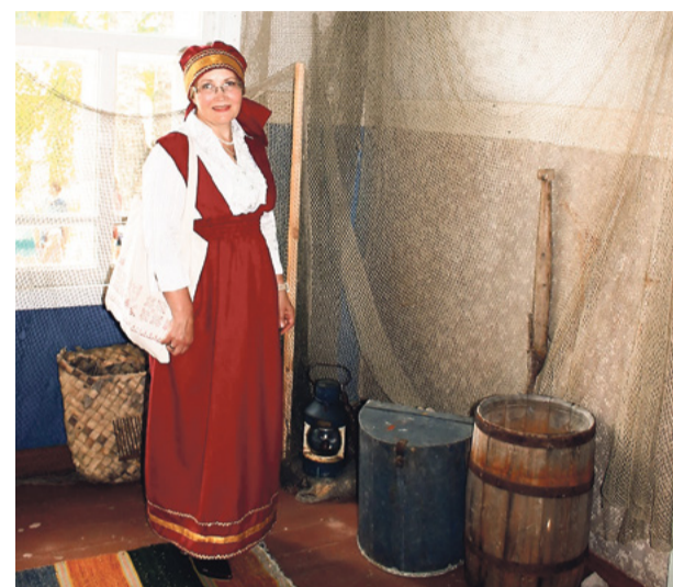
Тётка Камбалиха встречает гостей в Музее поморского быта

Благодаря новому проекту гости Камбалихи смогут теперь освоить и ткачество – древнейшее женское ремесло поморской деревни. В Кянде появятся ткацкие станки, заработает собственная мастерская. Авторы проекта надеются, что это не только поспособствует