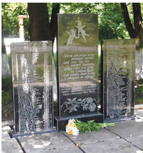
Памятник подневольным детям-донорам в г. Макеевке.