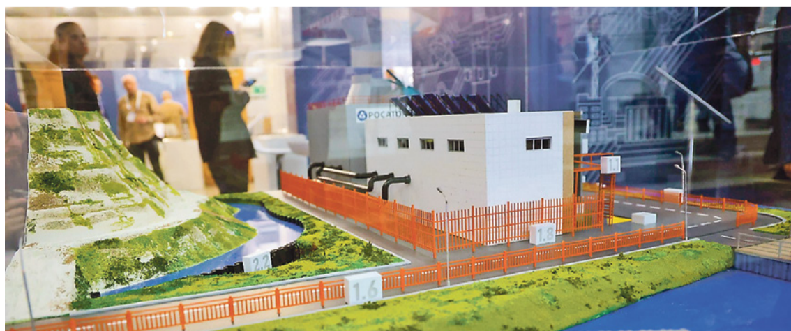
(О том, как прошёл II форум «Арктика – Регионы» – на 4-5 полосах)