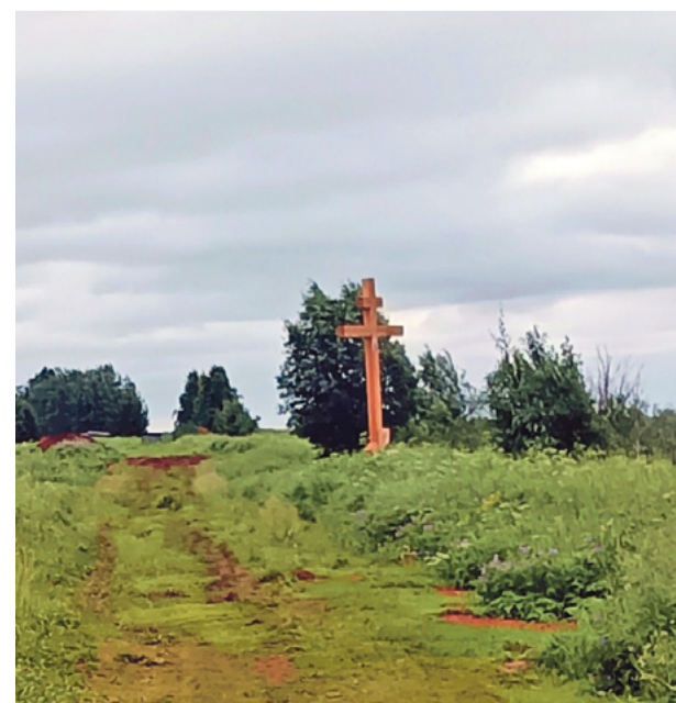
Поклонный крест на набережной, рядом с гостевым домом