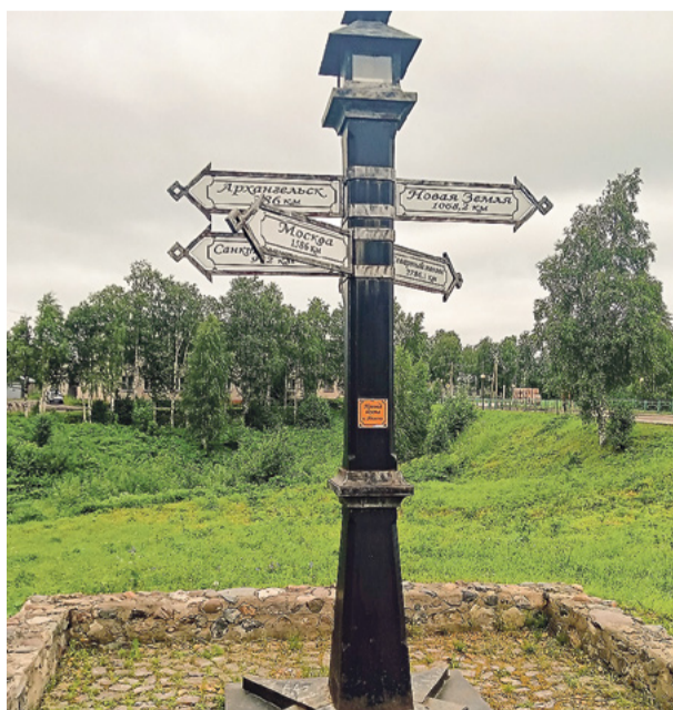
До Новой Земли здесь ближе, чем до Москвы