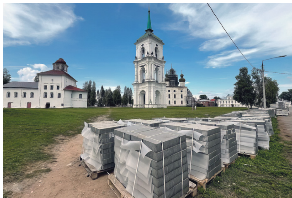
В Каргополе подготовка к преобразению идёт полным ходом