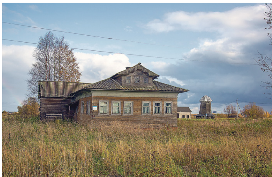
Историческое название места Ровдина Гора сохранилось в официальных документах. Табличка на здании бывшего ФАПа гласит, что он Ровдогорский