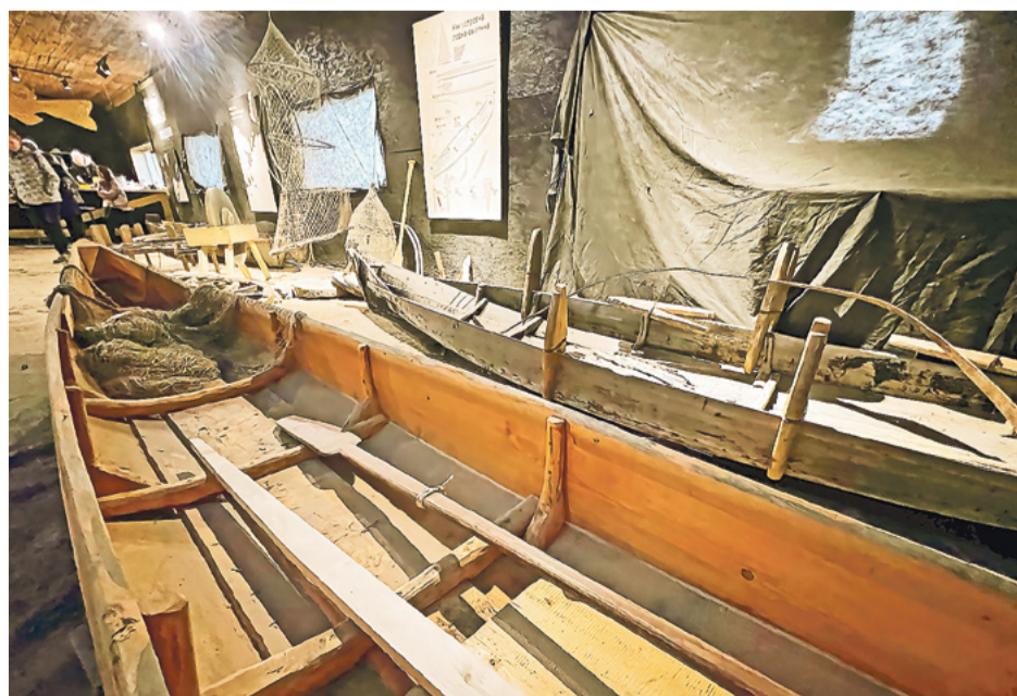
Участники проекта открыли «Музей живых лодок»