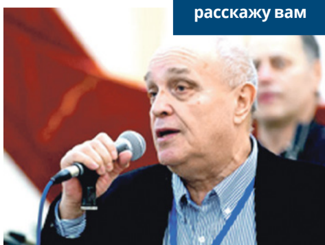
Владимир Лойтер.