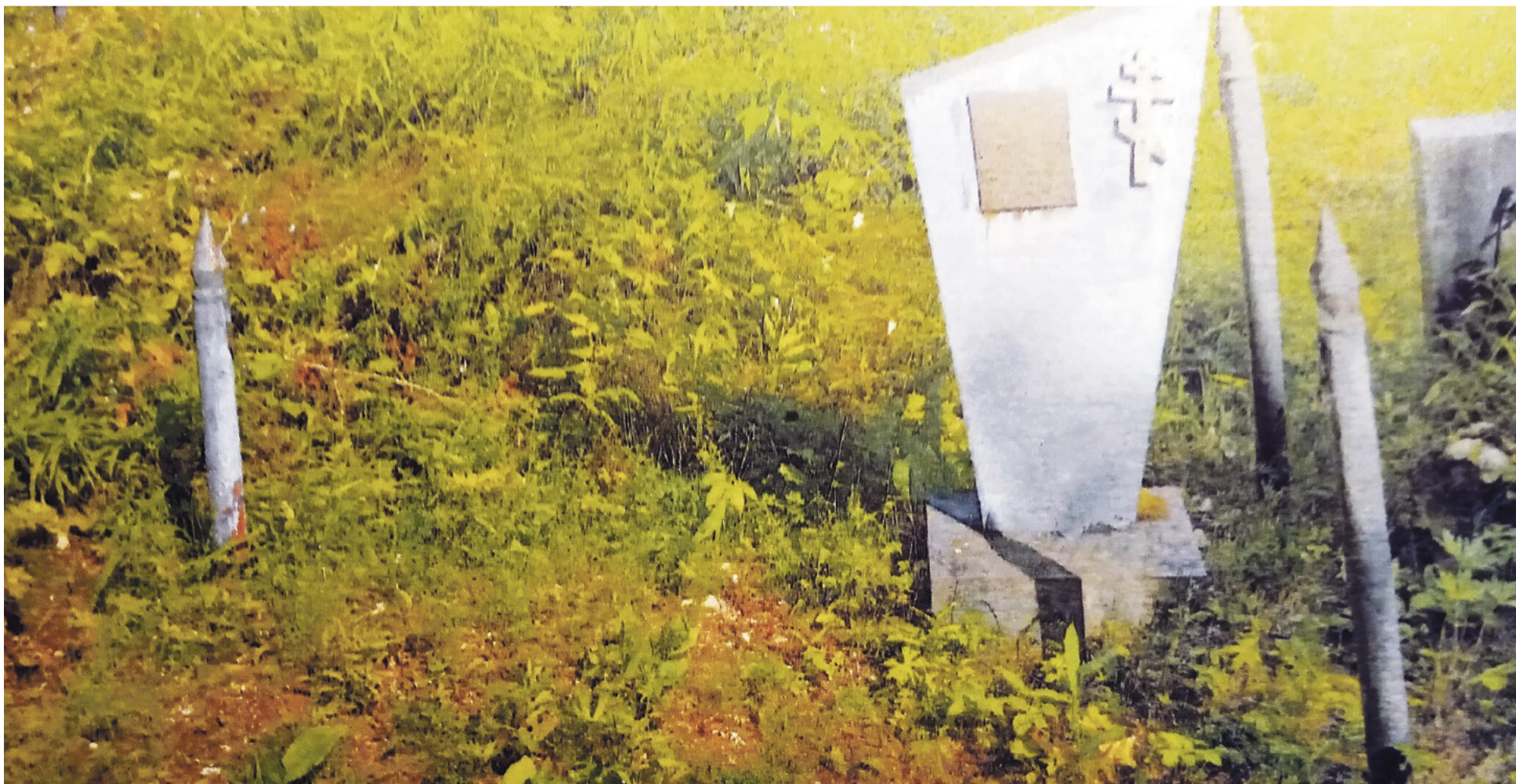
Пустые колышки на могиле ветерана – ни якоря, ни цепей

Наталья ПАРАХНЕВИЧ Фото автора и из архива семьи Архангельских