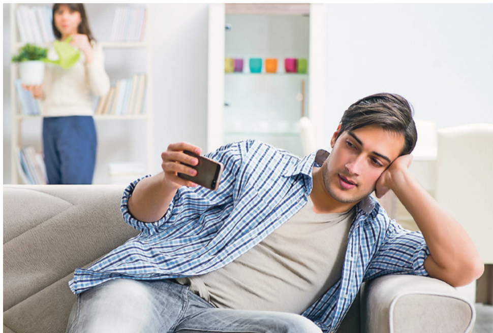
Если доверие подорвано, как правило, страдает и самооценка

Недавно на консультацию обратилась потенциальная приёмная мама – молодая женщина чуть старше тридцати. Зашёл разговор про её семью. «Мама с папой в разводе. Отец меня бросил. Отчим воспитывал». На вопрос, что из раннего детства помнит о родном отце, теряет: «Не знаю... Но мама говорила, что он меня лет до двух с рук не спускал. Везде с собой таскал, кашу сам варил. А потом «наигрался» и ушёл