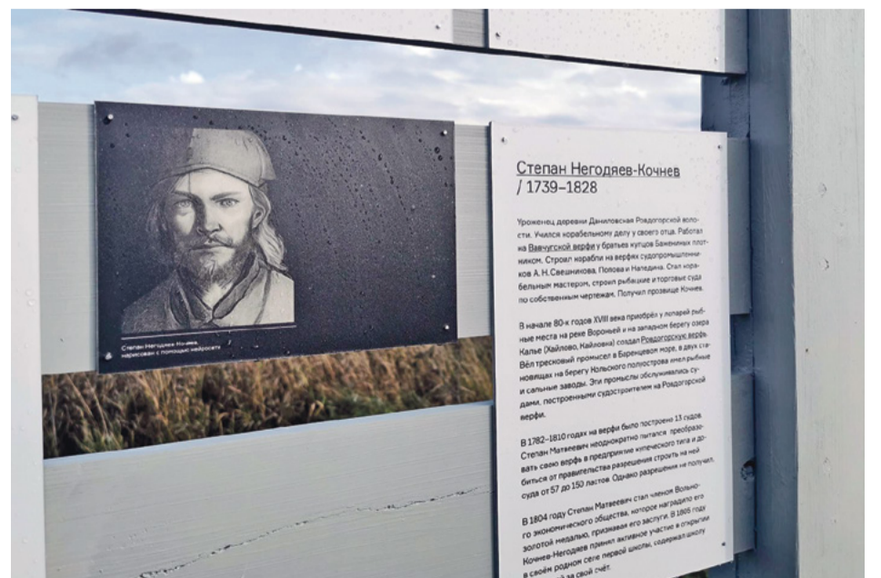
Фото Степана Негодяева сделано с помощью нейросетей