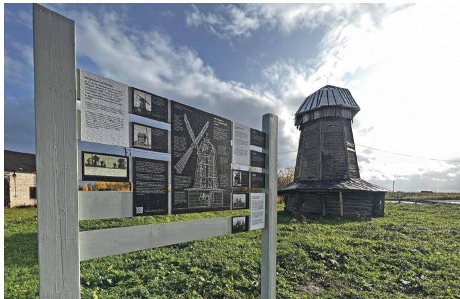
В этом году у мельницы установили информационные стенды для туристов

Сейчас мельница законсервирована – подниматься на неё небезопасно.