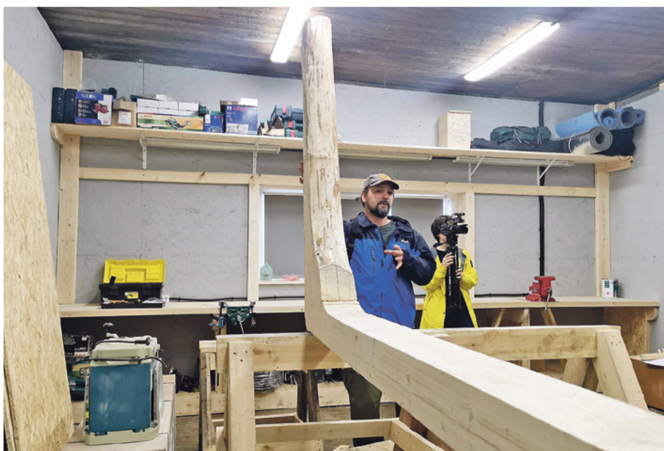
Кокору для карбаса искали почти год