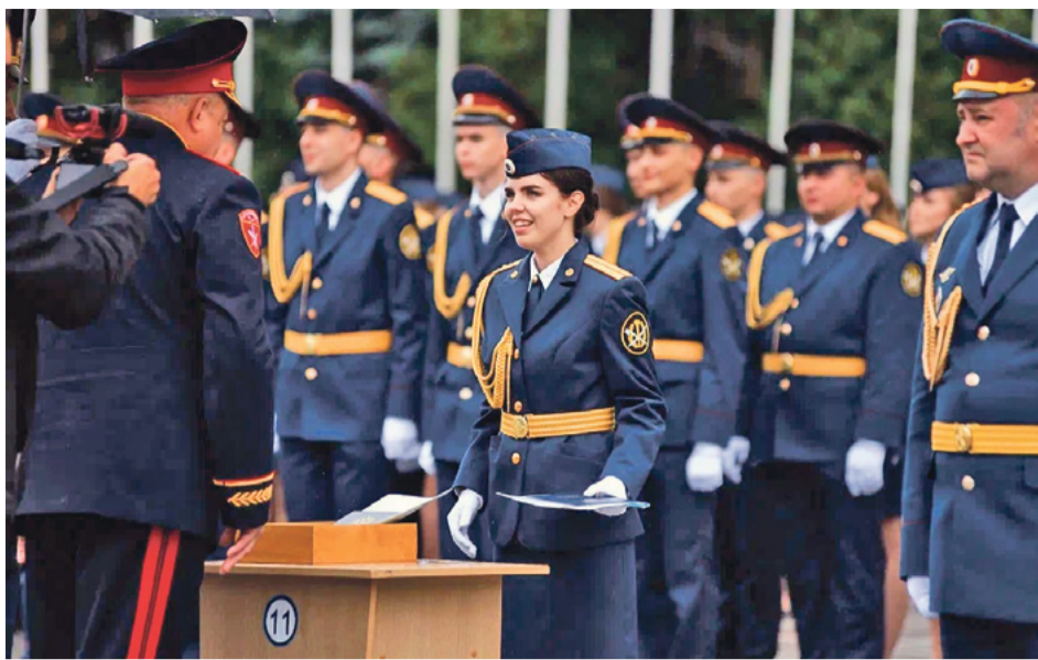
На выпускном в рязанской академии ФСИН России