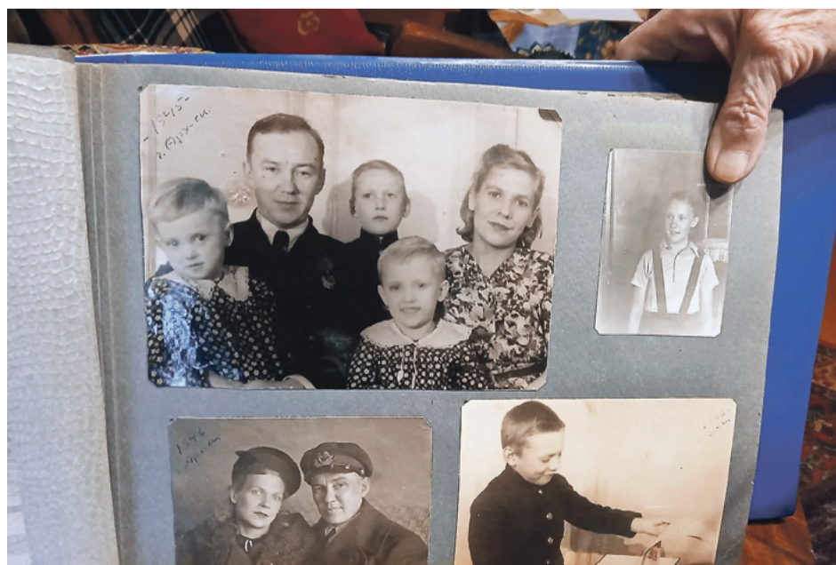
Фотографии из семейного альбома Архангельских. 1945–1948 гг.

Так получилось, что в тот рейс, когда «Марину Раскову» торпедировали