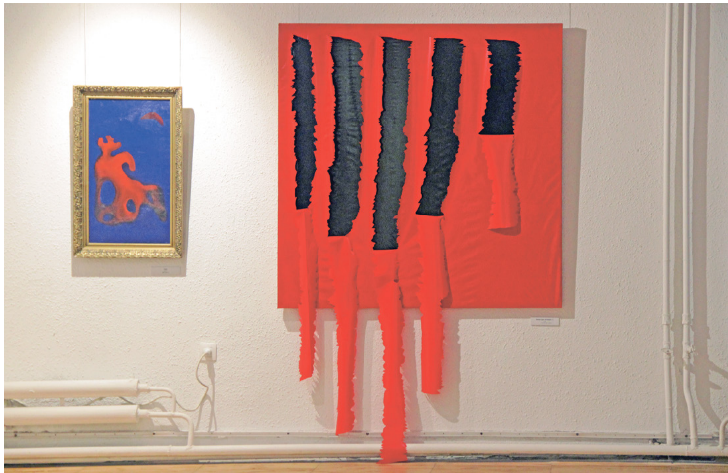
Отражение сегодняшнего времени в работах Марины Григорьевой

Работы, показанные на выставке, в основном недавние. Много абстрактных картин. Зрителя даже несколько ошеломляет буйство цвета выставочных работ, первое впечатление – преобладает красный. Тревожный и «неустойчивый» цвет сегодняшнего времени, выразитель наиболее глубоких и ярких эмоций.