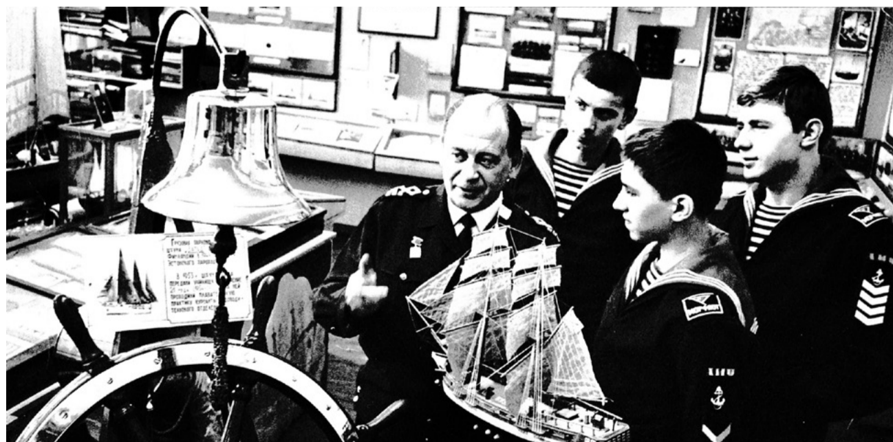
В музее мореходки.