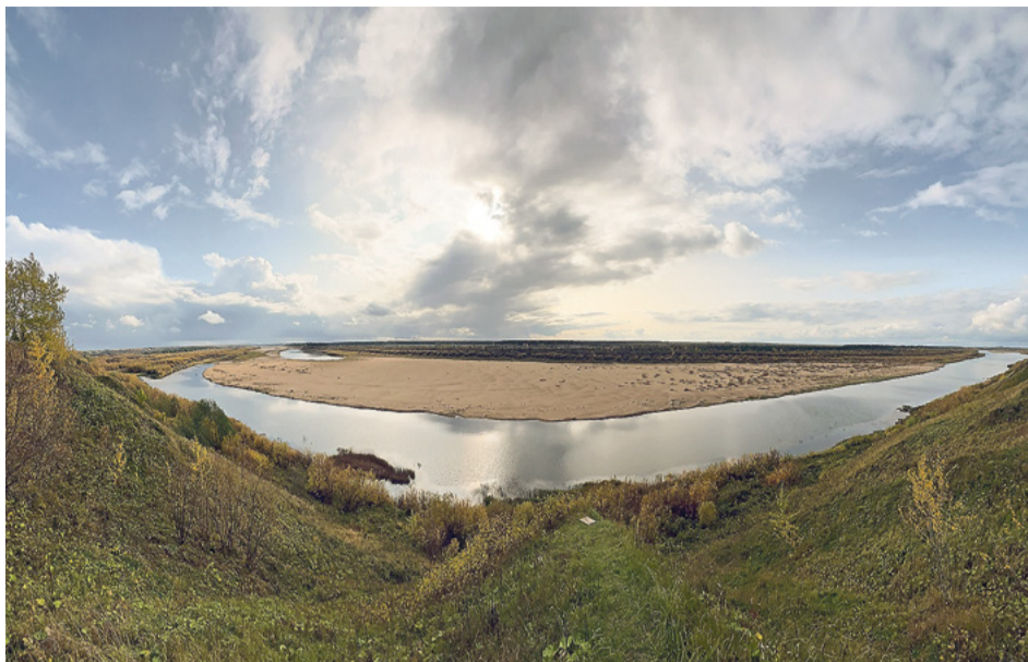
Река Ровдогорка. Вид со склона