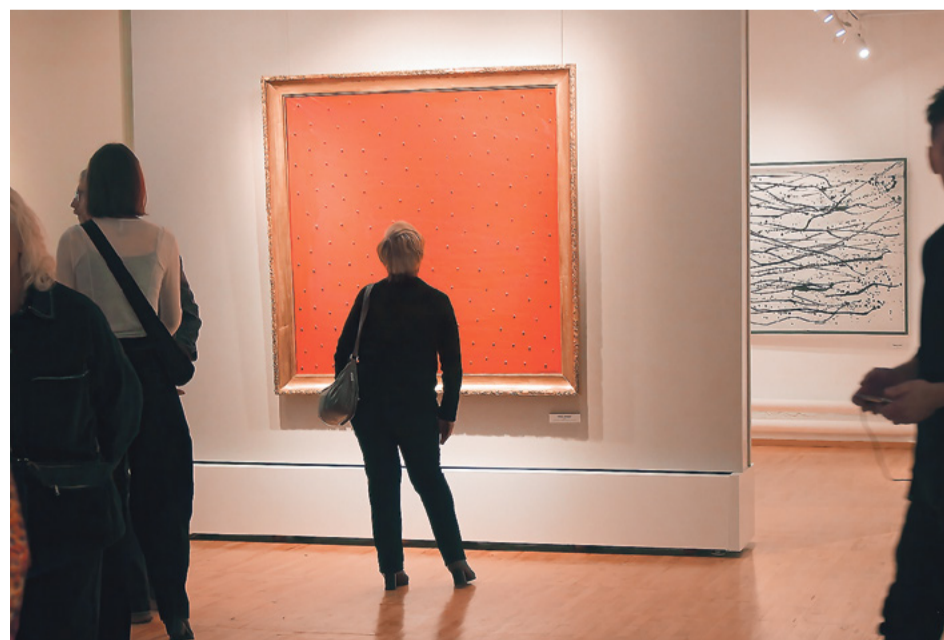
Перед картиной «Гибель империи» (полиэтилен, акрил, 2022 год)