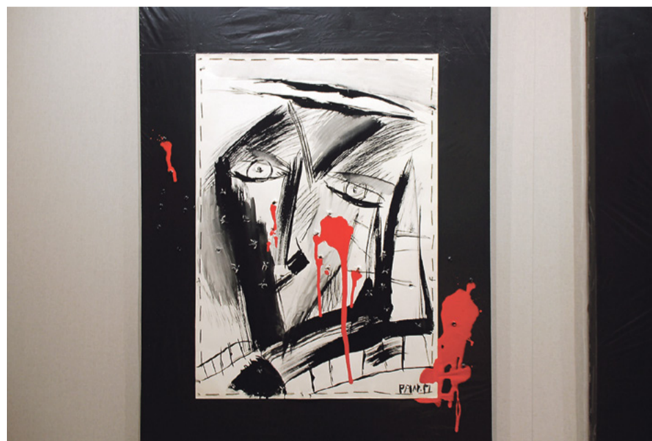
«Парадный портрет», 2014 год