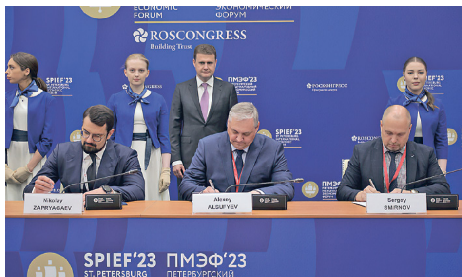
Заключено соглашение о сотрудничестве при создании нового высокотехнологичного судоремонтного предприятия полного цикла

Подготовила Марина СОСНОВА