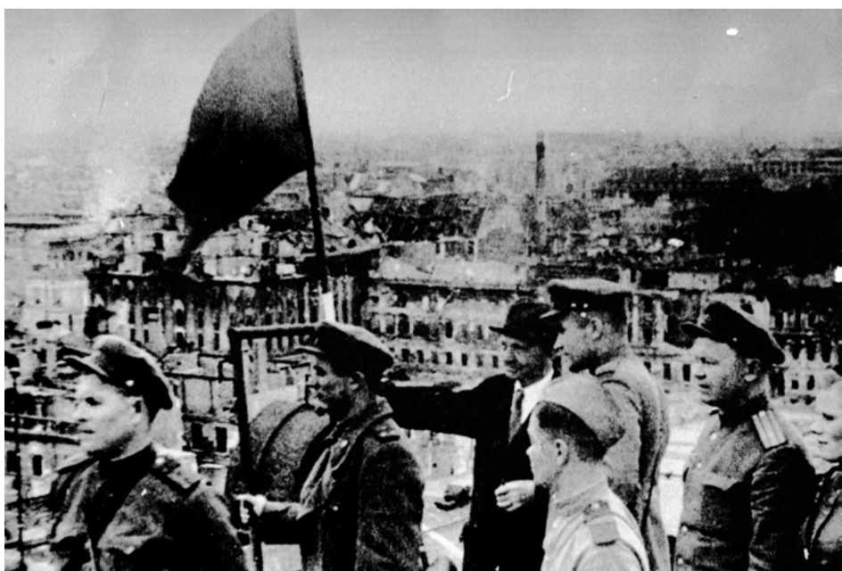
Знамя над Берлином

Сергей ДОМОРОЩЕНОВ Фото из архива «Правды Севера»