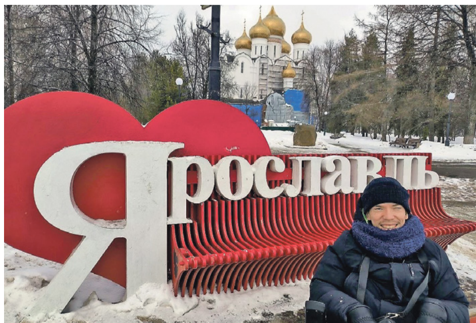
Поездка в Ярославль

– Можно было ограничиться теорией, – говорит он. – Но я выбрал Куликово