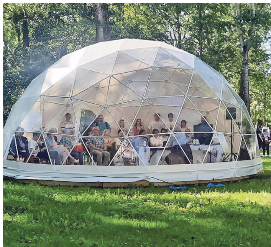
Круглые беседки, где проходят встречи писателей с читателями, стали своеобразной визитной карточкой фестиваля