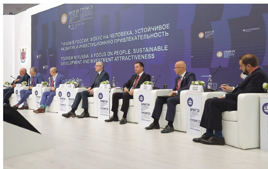
Идёт панельная дискуссия