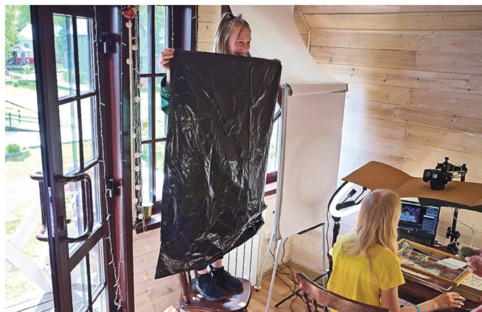
В одной из команд ребята по очереди держали вот такую «занавеску», чтобы избежать бликов на экране во время съёмки