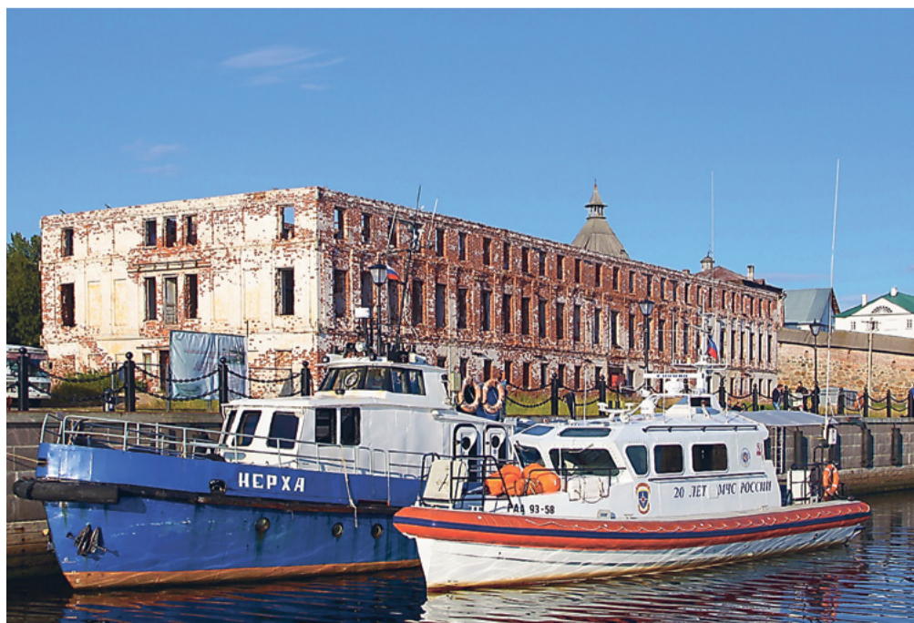
В морском маршруте «Поморское кольцо» особо привлекательными станут Соловки