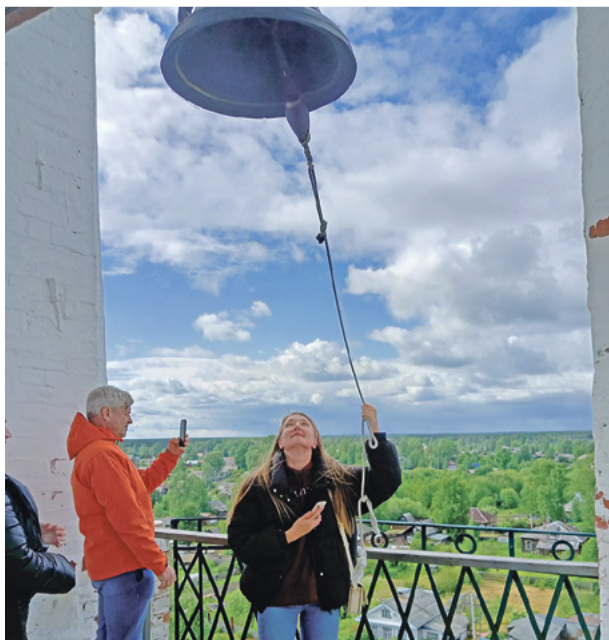
На колокольне Благовещенской церкви