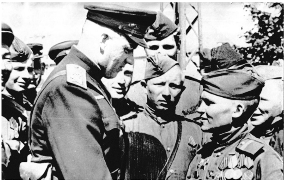
Маршал Рокоссовский и его солдаты