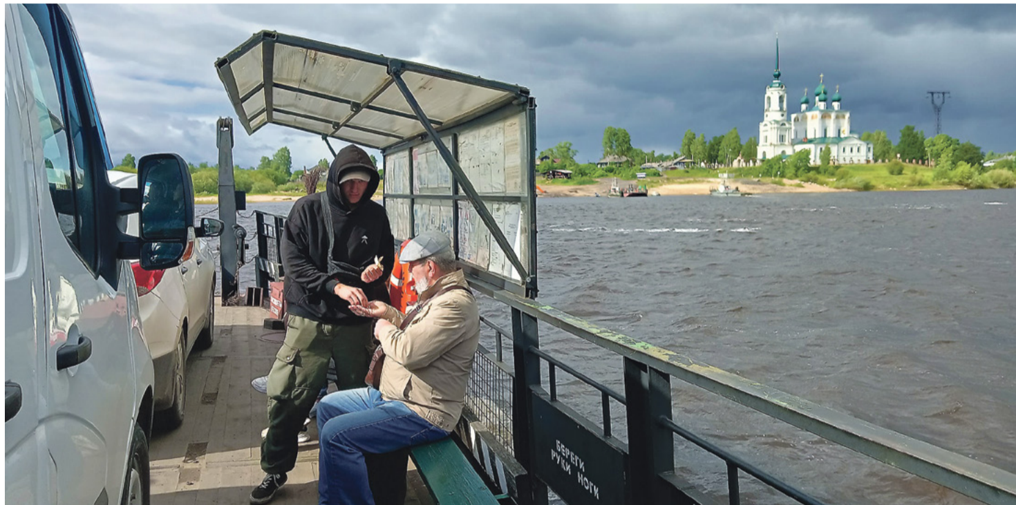
Для жителей Сольвычегодска летом паром – привычный вид транспорта

В марте 2021 года в Республике Коми прошёл первый туристический конгресс регионов Севера. Главным вопросом, который обсуждался на всех площадках