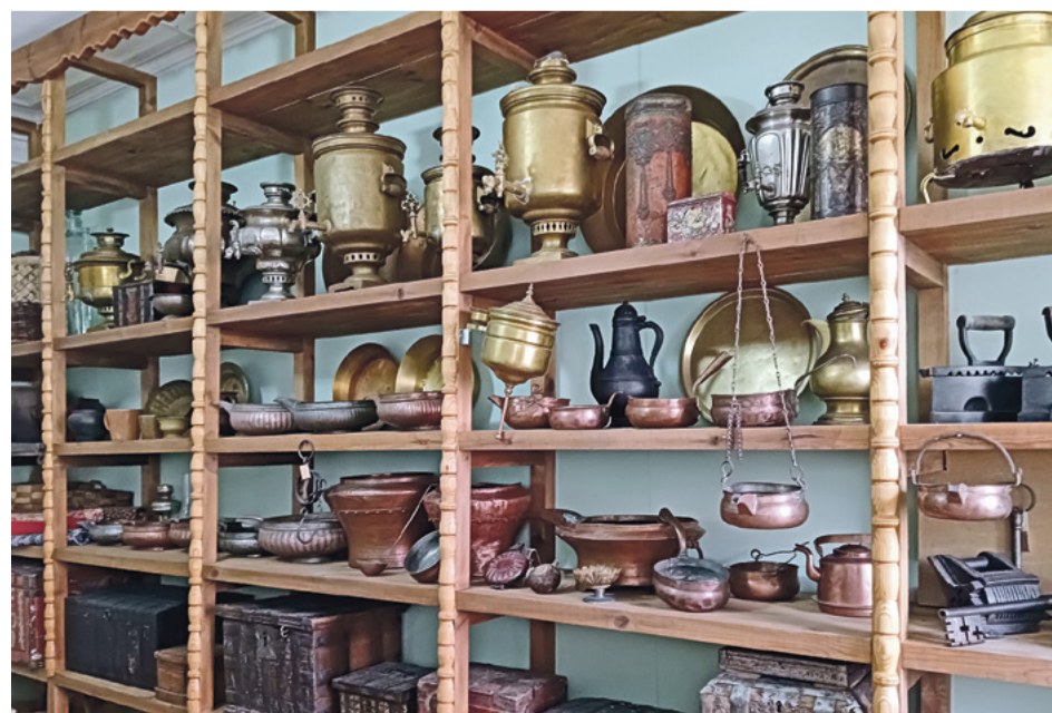
Так выглядела мелочная лавка купца Прокопия Хаминова