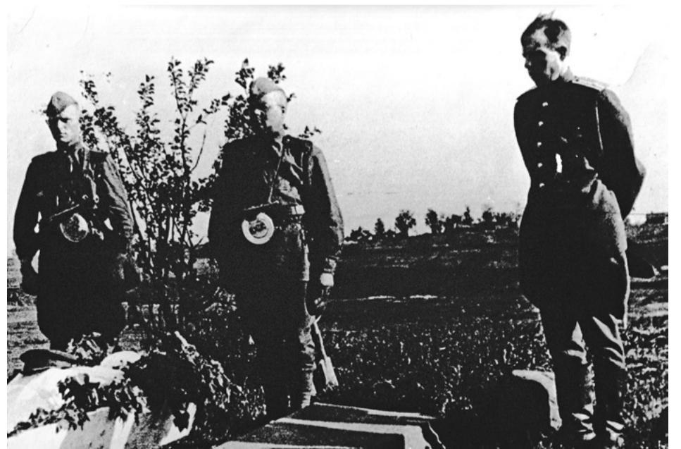
Прощание с однополчанином