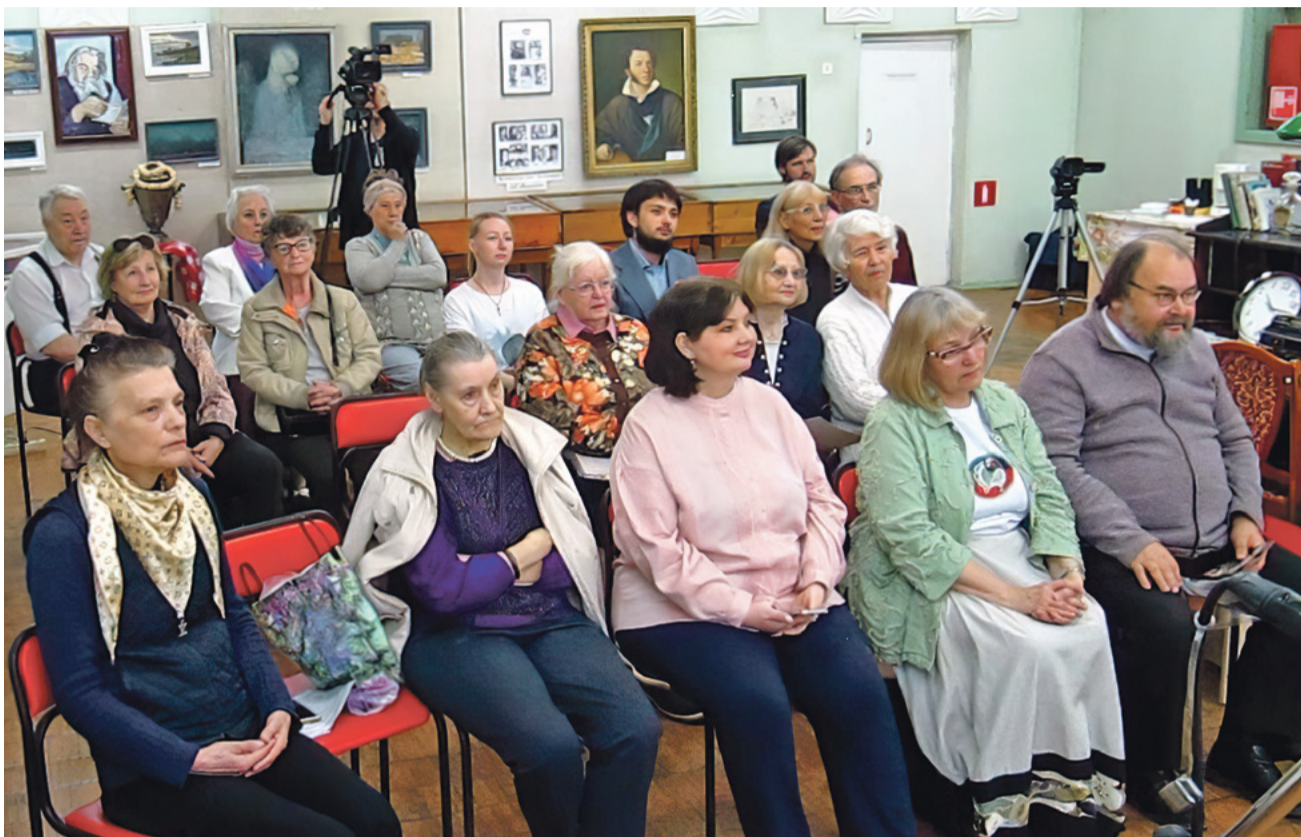
Дипломанты и лауреаты конкурса