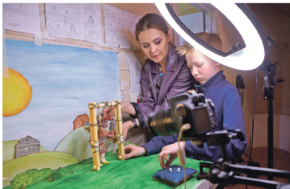
Подготовить с детьми за десять дней качественную кукольную анимацию – высший пилотаж. Даже не верится, что у педагогов – это первый опыт подобной работы