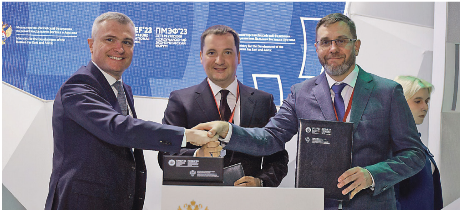
Подписание соглашения о финансировании строительства в Архангельске межвузовского кампуса «Арктическая звезда»

– Кампусы в нашем понимании не только новая инфраструктура, мы видим их роль в научно-технологическом развитии страны и социально-экономическом развитии регионов. Поэтому важно, чтобы специализации