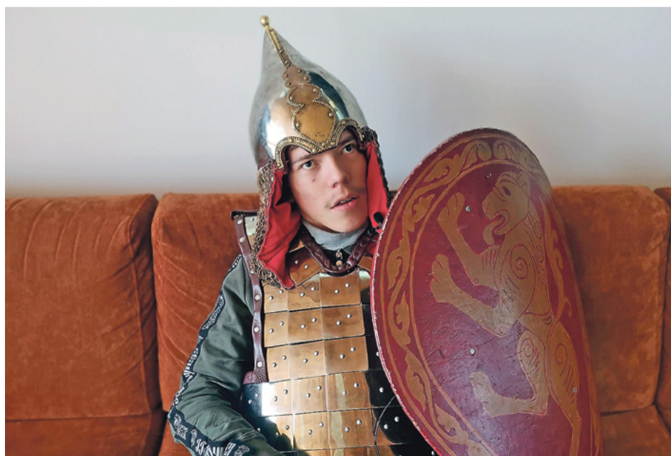
В музейном комплексе «Куликово поле»: «Попадаешь туда и ощущаешь себя частью истории»