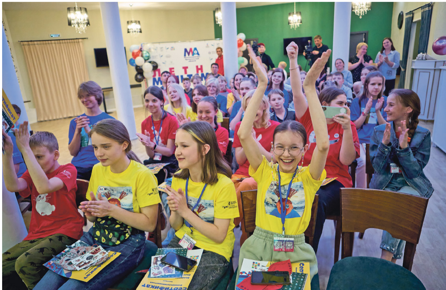
Вот оно – новое поколение будущих мультипликаторов: творцов и технарей