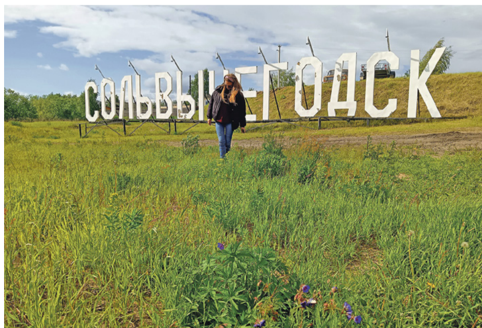
Туристы любят фотографироваться возле названия города